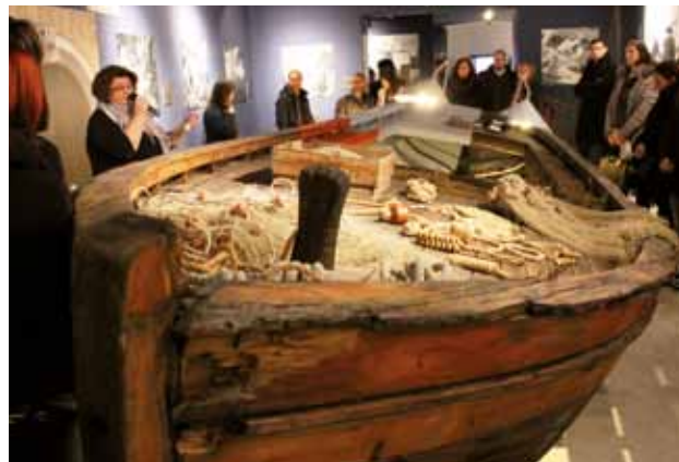
ISOLA: La batana al primo piano

il che ha certamente contribuito fortemente all'incremento e allo sviluppo economico, turistico ed imprenditoriale dell'Istria. Nel Museo viene enfatizzata la parte umana, più precisamente si è voluto porre in rilievo due figure: quella dell'uomo – pescatore e quella della donna – operaia. “Queste due professioni, presentate nella maggior parte delle fotografie, ci mostrano come si viveva a Isola, come avveniva il traffico marittimo e altro ancora” commenta ancora la dott.ssa Terčon. È stata allestita anche una sala didattica allo scopo di coinvolgere attivamente i visitatori nei temi presentati, tra giochi di intrattenimento che fanno conoscere la flora e la fauna del mare Adriatico e occhia-