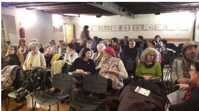
PALAZZO MANZIOLI: Il numeroso pubblico al Cineforum