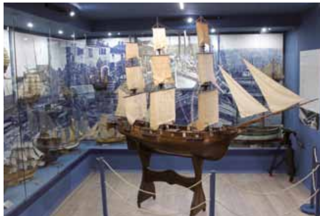
ISOLA: I modellini del museo Isolana

due culture, due nazionalità: quella italiana e quella slovena. Al bilinguismo delle descrizioni si associa anche l'inglese, mezzo linguistico che apre i contenuti del museo ad un contesto culturale più ampio”. Il primo piano restaurato offre una veduta sul passato, partendo dalla sala Pietro Coppo, personaggio diventato famoso a livello mondiale, come autore del tentativo pionieristico di stampare il primo atlante nella prima metà del XVI secolo. Attraversando il “tunnel Parenzana”, avvicinandosi a Isola, si incontrano importanti sportivi isolani, per poi arrivare alla sala più piccola dove viene presentato il passato e il significato della ferrovia Parenzana. Rappresentava forse il più importante collegamento tra l'entroterra istriano e le località balneari,