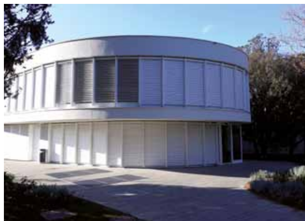
PUNTA GROSSA: L'esterno del centro di cure

GERGETA: Certo, si stanno facendo dei passi avanti, ma tutto procede lentamente e ancora si fa troppo poco. Anche persone come mio figlio hanno dei sentimenti e necessità, è perciò importante garantire loro le condizioni per una vita dignitosa. È un loro diritto. La mia preoccupazione