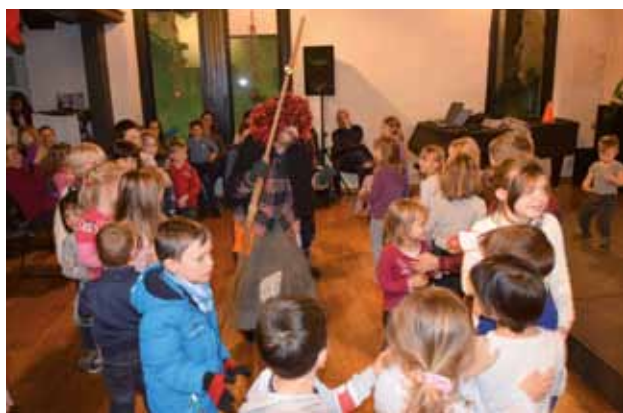
PALAZZO MANZIOLI: La Befana gioca coi bambini