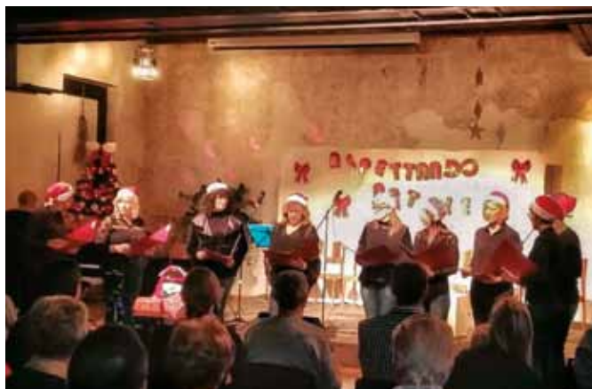
PALAZZO MANZIOLI: Rondini In-canto

nonostante i numerosi impegni di ciascuna, riescono sempre a trovare il modo di essere presenti alle prove. In genere ci troviamo due volte alla settimana nella vecchia scuola elementare italiana. Lavorare assieme è benefico per tutte: si respira aria di positività, si instaura un'atmosfera gioiosa e serena, merito del canto, ma anche della loro indole. D'altronde sono del pensiero, che le donne dispongono di una forza interiore particolare e hanno innato il senso della dedizione e del sacrificio.