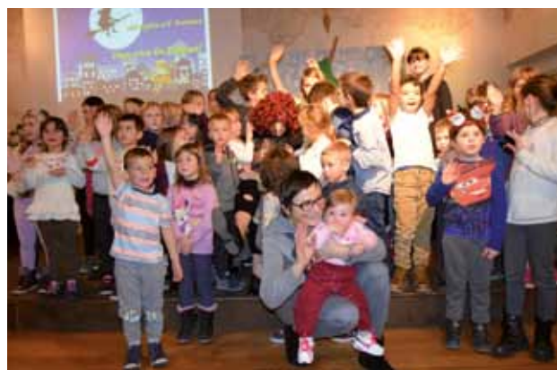
PALAZZO MANZIOLI: Tutti insieme alla Befana

tecnici, hanno saputo eseguire la canzone a cappella con estrema bravura, a ritmo e con un’intonazione impeccabile. All’apice della manifestazione a bussare alla porta è stata l’immancabile Befana, che ci ha dichiarato di venire sempre con molto piacere a visitare i bambini di Isola, che ormai la accolgono con calorosi abbracci. “È sempre bello vedere la Sala Nobile così gremita e ciò mi rende molto felici.