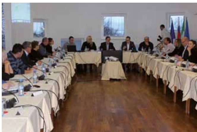
ISOLA: Il Consiglio comunale in riunione