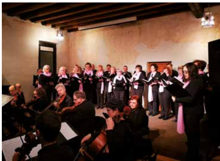
PALAZZO MANZIOLI: durante il concerto

una compilazione comune. I presenti al concerto di gennaio hanno avuto anche la possibilità di far propria una copia del cd.