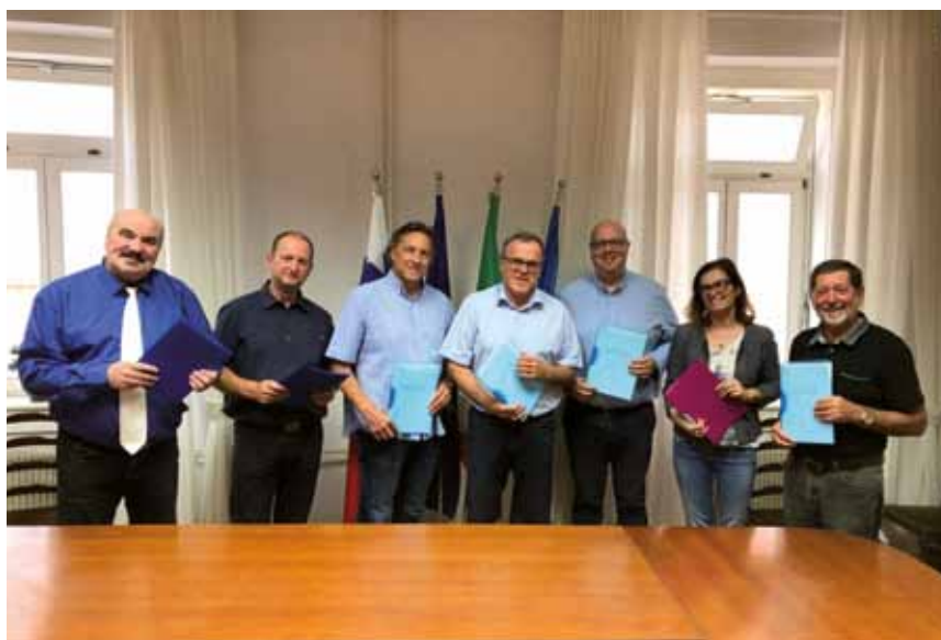
ISOLA: La coalizione per Isola

Come ha specificato anche il sindaco questo non preclude che non ci sia collaborazione anche con gli altri membri, perchè l'intento è sempre quello di collaborare a livello di Consiglio comunale in generale con tutti. Comunque supportiamo sicuramente i progetti proposti dal sindaco, sono quelli che secondo noi