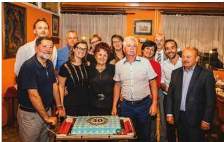
ISOLA: Foto di gruppo

anche in altre città del Paese, ufficialmente per motivi economici. Non penso che sia questo il motivo principale, basti pensare che nel 2021 Isola avrà oltre 17.000 abitanti e un solo ufficio postale sarà indubbiamente troppo poco. Altro tema di massima attualità è il piano territoriale comunale: solo la CL di Jagodje Dobrava ha avanzato oltre 10 proposte, tra cui la creazione di un parco con angolo giochi per i bambini, vicino alla nostra sede, di un'area di servizio, di un