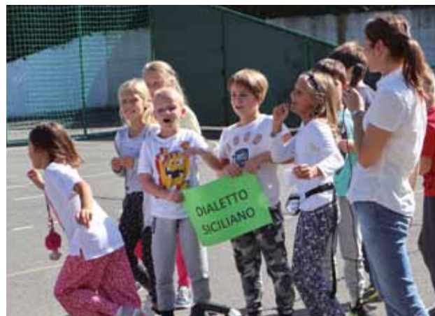
ISOLA: Attività in cortile

Questa attività è stata molto importante perché ha permesso di rafforzare l'autostima degli alunni stranieri, nonché di valorizzare le loro radici culturali, creando un clima positivo di accoglienza e cooperazione fra gli alunni.