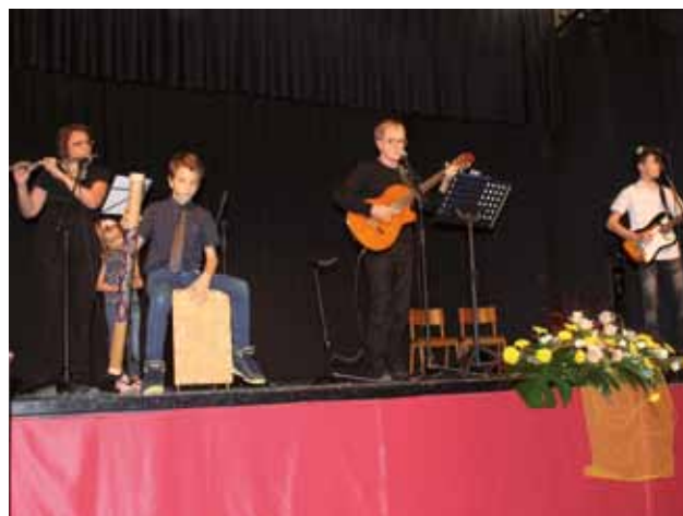
BERTOCCHI: I Pane e refosco