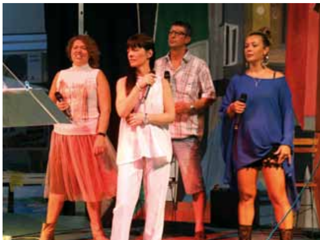
PIAZZA MANZIOLI: I cantanti della Dante