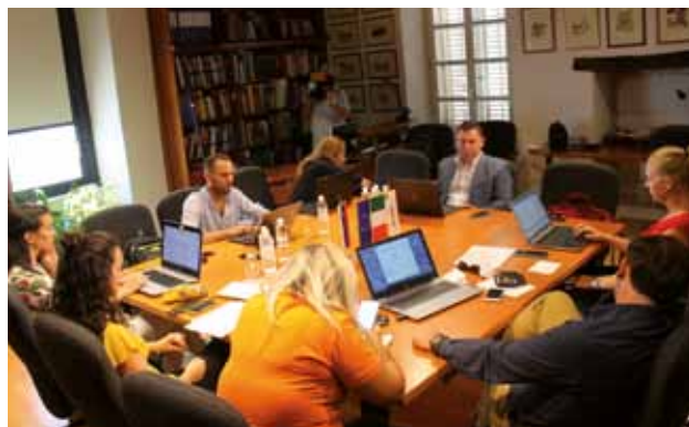
PALAZZO MANZIOLI: La Giunta in seduta