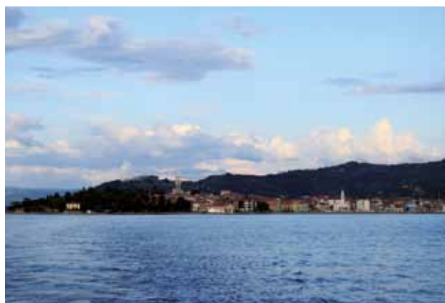
ISOLA: Veduta dal mare