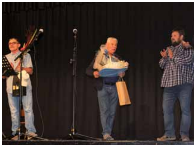
BERTOCCHI: Scambio di doni tra i presidenti