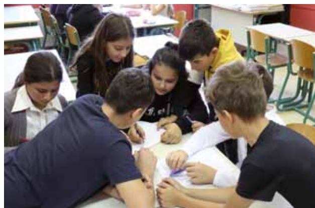
ISOLA: Attività in classe

La scuola elementare "Dante Alighieri" crede moltissimo nella valorizzazione dei principi della diversità culturale, che rappresentano un valore educativo fondamentale per tutta l'attività didattica. Pertanto la Giornata europea delle lingue, ricorrenza che si celebra ogni 26 settembre, è un'importante occasione