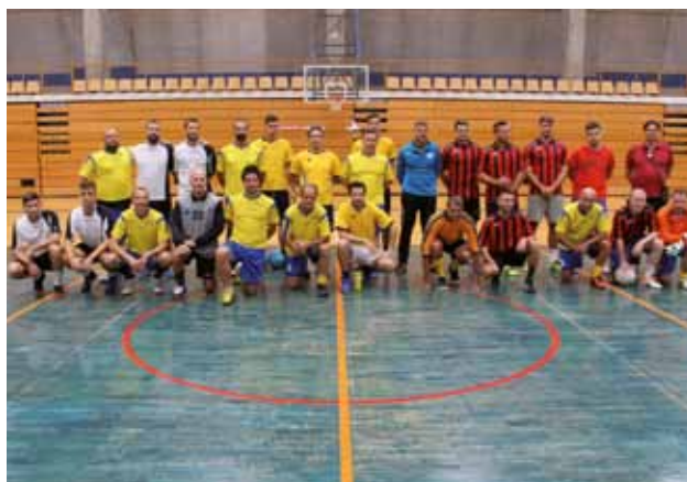
ISOLA: Foto di gruppo del tradizionale torneo di calcetto