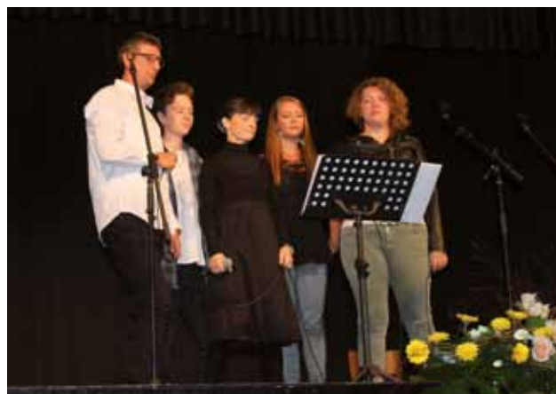
BERTOCCHI: I cantanti della Dante