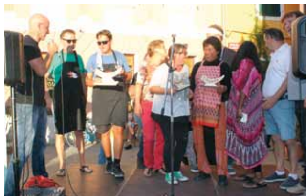
ISOLA: Premiazione in Piazza Manzioli

Piazza Manzioli è stato cucinato con grande fantasia, ma attenendosi alle regole basilari della cucina di provenienza. Una giuria ha valutato il risultato finale, tenendo conto dell'originalità delle ricette, di quelle più inedite e più armoniose, se così si può dire per pietanze molto particolari, che possono affascinare una cerchia ristretta di appassionati, ma non certamente la maggioranza dei convenuti. Su un