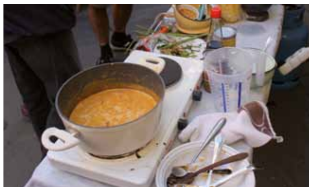
ISOLA: Una delle pentole con il chili

mamme o nonne erano solite diffondere anche in casa. Ma la rassegna del chili abbinato al cioccolato, è una delle più attese a Isola, pur non avendo nulla da spartire con le nostre terre. Gli ingredienti provengono da oltre oceano. Il chili altro non è che il peperoncino di origine messicana, diffusosi poi negli Stati Uniti e da qui in tutto il mondo. È riservato agli amanti delle specialità piccanti, quelle che “infiammano la bocca per una settimana” come detto da uno dei giudici a Isola. È stato preparato senza fare sconti al palato nostrano. Sulle bancarelle disseminate da Via Lubiana a