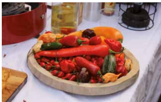
ISOLA: Il chili in bella mostra

Ormai chi attraversa le vie isolane del centro durante i fine settimana si attende di percepire fragranze molto marcate. Le manifestazioni gastronomiche d'agosto ci hanno abituato al colore rosso fuoco della salsa, cucinata in vari modi da agguerrite squadre. In settembre arriva il basilico, con il suo forte aroma e con gli abbinamenti più fantasiosi. Fin qui sono profumi delle nostre cucine istriane che le nostre