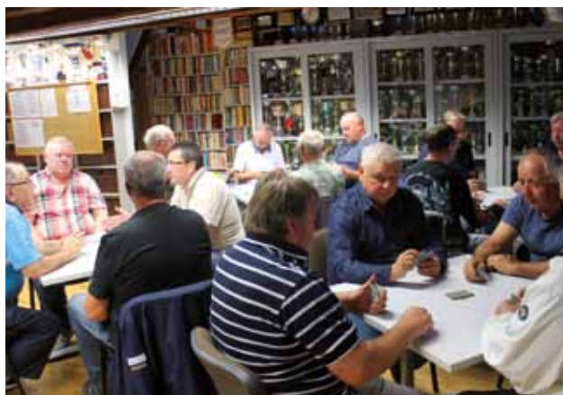
PALAZZO MANZIOLI: Torneo di briscola