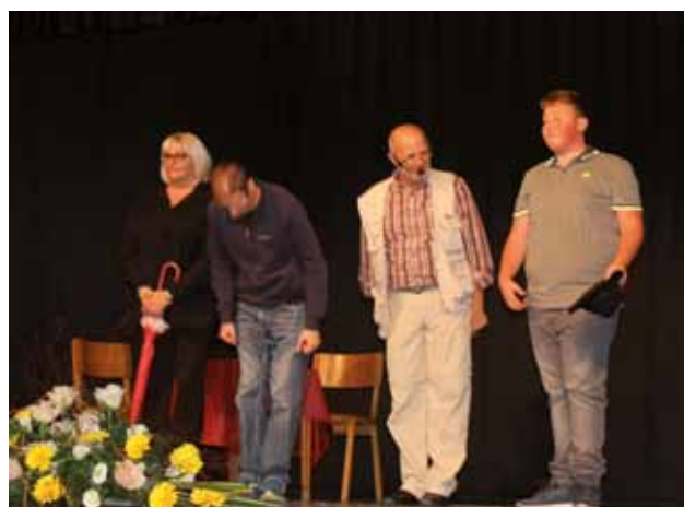
BERTOCCHI: La filodrammatica della Besenghi