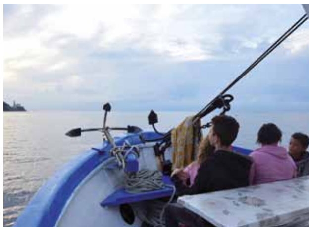
GOLFO DI ISOLA: Vedette a prora