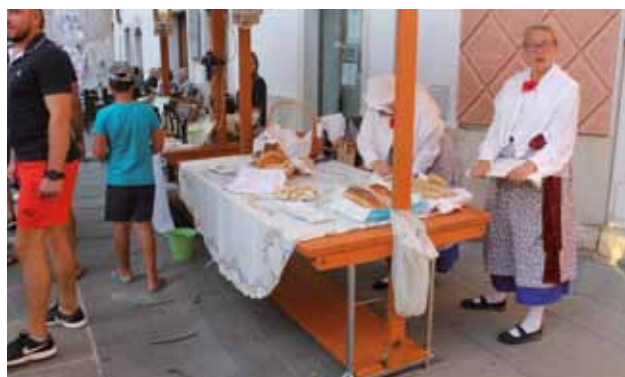
ISOLA: Bancarelle in piena azione

Sabato, 14 settembre è stato un sabato particolarmente fitto di eventi a Isola. Poterli visitare tutti sarebbe stato impossibile, scegliere è stato arduo, anche perché si rischiava di rompere le tradizioni. Gli amanti del mare non hanno potuto mancare in mattinata alla Regata diplomatica. Oltre 150 tra ambasciatori, consoli, uomini d'affari e politici hanno vissuto una giornata in mare e lungo le rive, allacciando nuovi rapporti di collaborazione o cementando conoscenze precedenti. La gara sul triangolo di mare davanti a Isola è diventata quasi un pretesto, sebbene siano scesi in mare alcuni maxi-yacht, comandati da skipper di