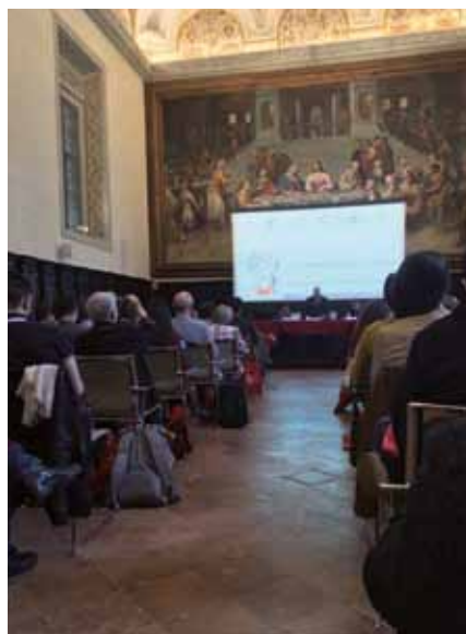
RAVENNA: Apertura dei lavori

baziale con una superficie di 28.000 mq ( https://www.classense.ra.it/storia/# ). Altra prestigiosa sede è il Dipartimento di Beni Culturali dell’Università di Bologna – Sede di Ravenna ( https://www.myravenna.it/2018/09/11/studiare-a-ravenna/ ). I moltissimi interventi sono stati divisi in sessioni parallele, da svolgersi in diverse giornate e separati nelle diverse aule uniti però da un argomento; ogni sessione aveva un presidente e quattro (4) oratori. La prima sessione si