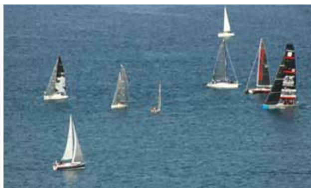
ISOLA: Le vele in golfo

addetti a mantecarlo con olio d'oliva, brodo e aglio, sino a ottenere una pastella omogenea. Ci voglio braccia forti e "olio di gomito", importante quasi come quello d'oliva per la buona riuscita del piatto. Nella ricetta tradizionale non sono ammesse aggiunte che, invece, vengono incluse nelle versioni commerciali, vendute nei negozi. Quasi blasfemo, ad esempio, mischiare al baccalà le patate lesse. Per apprezzarlo al meglio alcuni puntano sui crostini di pane e altri sulla polenta. Nella versione "rossa" viene aggiunto al sugo e servito con fusi o tagliatelle. Il suo odore molto forte non lascia indifferente nessuno: c'è chi lo adora e chi invece