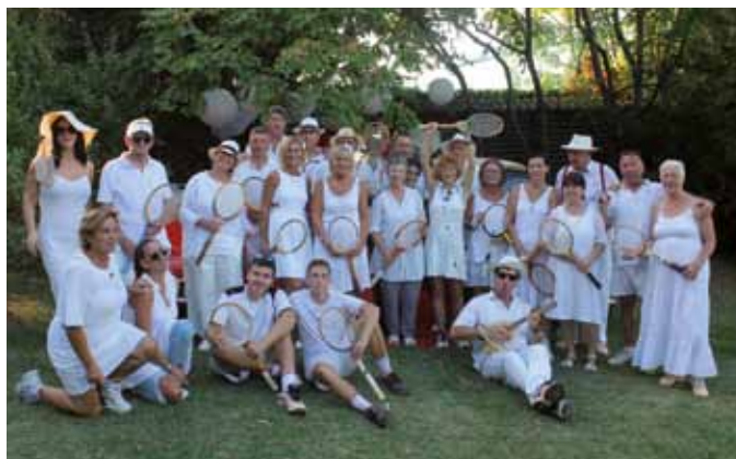
SAN SIMONE: La foto di gruppo

Un tuffo nel passato, quando il turismo lungo la costa era di classe, quando alcuni sport erano riservati soltanto ai ricchi ed erano abbinati alle macchine di lusso. È l'atmosfera ricreata sabato a San Simone, dalla Comunità degli Italiani "Pasquale Besenghi degli Ughi" con il torneo di tennis "old time". Una ventina di giocatori hanno accolto l'invito alla competizione di doppio con racchette in legno, abbigliamento rigorosamente bianco e d'epoca: pantaloni lunghi e camicia per gli uomini, gonna lunga e blusa per le donne. Alcuni hanno preso le regole alla lettera, aggiungendo ancora cravatta, cappello e altri accessori. Per tutta la giornata si sono sfidati, componendo le coppie con il sistema "champagne", ossia sorteggiandole prima di ogni