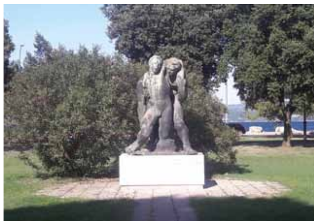
ISOLA: La statua di Dequel nei pressi del cimitero

attendere clemenza. Momento che consacra l'amore che la nostra cara Isola nutre per le opere incompiute. Cara Isola cerca di fare un ulteriore sforzo, magari con una nuova colletta, anche perché è opera di un grande della scultura internazionale e di indiscusso valore artistico. Ricorderemo che Oreste Dequel, nato a Capodistria il 17 agosto del 1923 e morto a Roma il 24 marzo 1985, si è diplomato presso l'Accademia di Belle Arti di Lubiana e che oltre alla sua attività artistica universalmente riconosciuta, fu titolare della cattedra presso l'Accademia di Belle Arti di Iowa City (USA) e della cattedra presso l'Accademia di Belle Arti di Salisburgo (Austria).