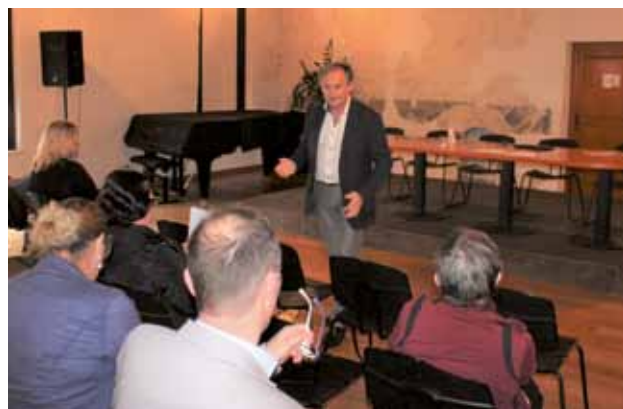
PALAZZO MANZIOLI: Tremul con i connazionali

indebolire CAN e UI nei rapporti con Lubiana ossia con Roma. Va trovata la formula per poter collaborare in modo istituzionalizzato, facendo politica, cultura e aggregazione assieme. Manca un accordo formale sulla collaborazione tra CAN e UI. Il deputato al parlamento sloveno, Felice Žiža, presente come attivista della CI »Dante Alighieri«, si è anch'egli soffermato sull'urgenza di trovare un modo per regolare la stretta collaborazione istituzionale tra la CAN e l'UI. Circa lo statuto in dibattito ha proposto ancora uno snellimento dell'Assemblea dell'Unione e il conferimento di maggiori poteri (anche di veto) all'attivo consultivo delle Comunità degli Italiani, che nell'Assemblea stessa fungerebbe da seconda camera. Il parlamentare si è riservato di inviare per iscritto le altre proposte che ha in serbo. All'ultima parte del dibattito hanno partecipato anche gli altri connazionali, che si sono soffermati principalmente sull'uso della lingua italiana nella vita di ogni giorno, ma non hanno toccato il tema dello statuto dell'UI.