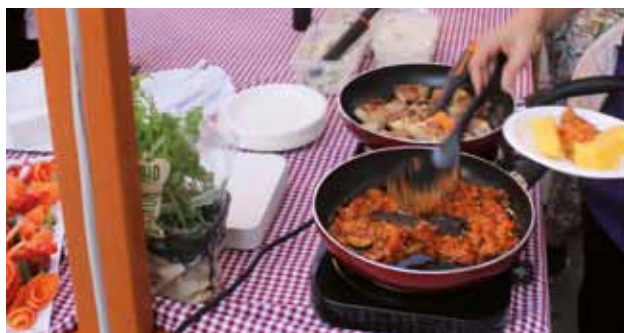
PIAZZA MANZIOLI: Baccalà in sugo