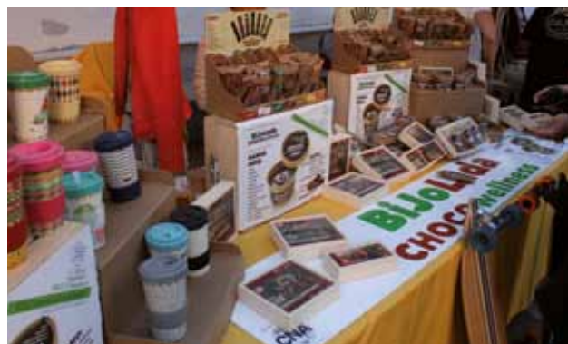
ISOLA: Cioccolato e altre specialità