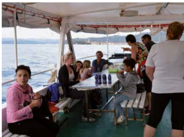
GOLFO DI ISOLA: I gitanti in coperta