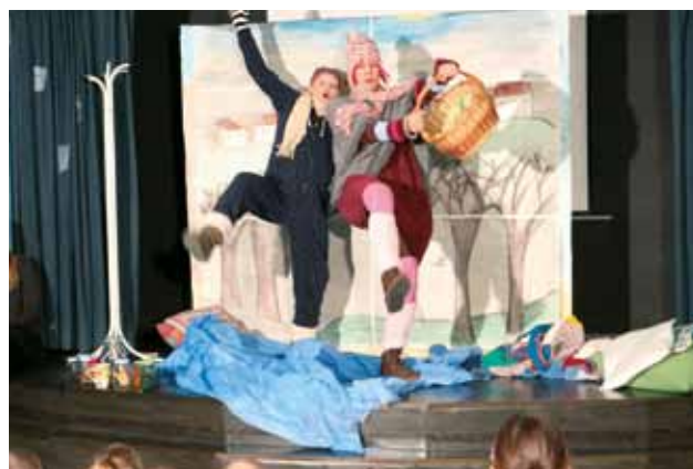
ISOLA: Educatrici in scena