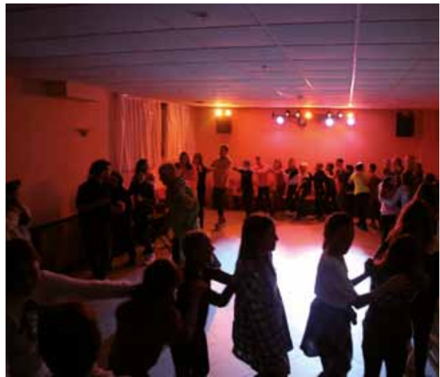
FORNI DI SOPRA: Serata in discoteca