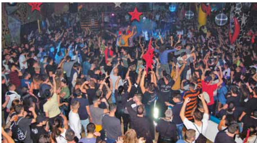
ISOLA: Festa al Gavioli