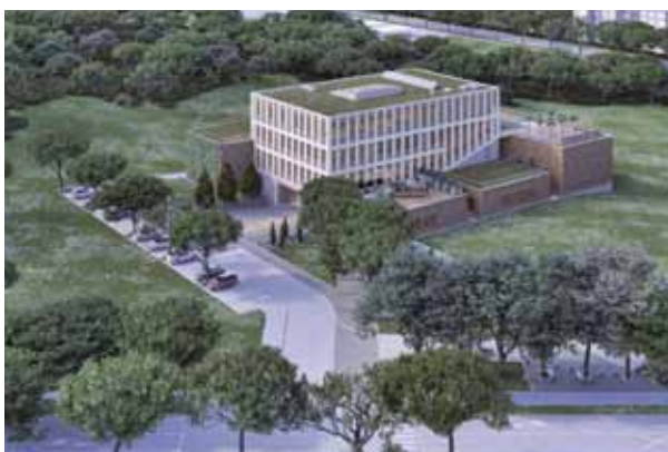
ISOLA: Il progetto del centro di ricerca

Sono partiti formalmente nei giorni scorsi nel rione isolano di Livade i lavori di costruzione del centro di ricerca InnoRenew CoE. La costruzione delle due palazzine sarà completata, secondo i progetti, entro settembre 2021. Il complesso fungerà da sede per importanti ricerche sulle possibili innovazioni nel campo dei materiali rinnovabili e di un sano ambiente per la vita dei cittadini. Sarà unico nel suo genere in Slovenia e molto simile agli altri dieci già operanti sotto l'egida della Commissione europea, nell'ambito del programma Orizzonte 2020, con il quale vengono supportati 169 iniziative per un valore complessivo di 15 milioni di euro. Il Governo sloveno co-