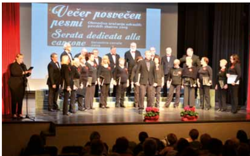
ISOLA: Un esibizione del coro

è un repertorio di musica popolare e sacra – quelli che preferisco sono i canti popolari, mentre il progetto che mi è rimasto particolarmente impresso è stato quello di circa 10 anni fa, dedicato al compositore triestino Antonio Illersberg, che ci ha visto esibirci con altri due cori e alcuni solisti del capoluogo giuliano. È stato un evento davvero speciale che ricordo ancora oggi con molta emozione, pur essendo passato già tanto tempo”.