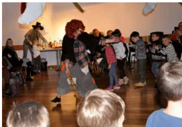
PALAZZO MANZIOLI: La Befana accolta dai bimbi

«È una festività particolarmente sentita da parte della nostra Comunità e ci teniamo particolarmente ad orga-