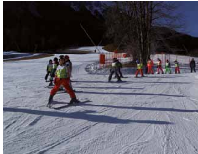
FORNI DI SOPRA: Discese sulla neve