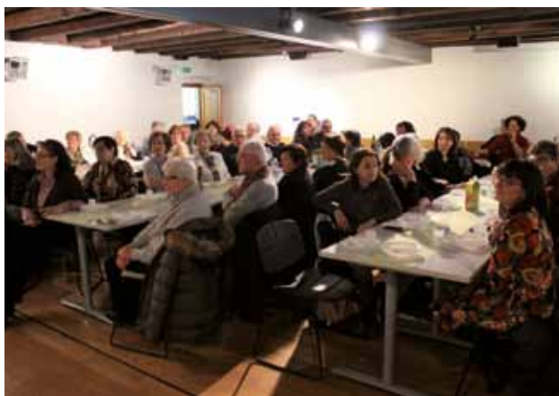
PALAZZO MANZIOLI: La serata conviviale

di Buie. In rapida successione sono stati poi presentati il video delle escursioni della CI in Friuli e a Ploštine, dove si è celebrata una sorte di gemellaggio con i connazionali della locale Comunità degli Italiani. I presenti in sala si sono divertiti a rivedersi nelle immagini e nelle foto. Hanno tributato all'autore degli scroscianti applausi. La fine dell'anno è come sempre occasione di bilanci che per la "Besenghi" non può che essere positivo. Partendo dal primo semestre 2019 poniamo in evidenza la partecipazione della CI all'importante progetto storico-culturale "I Carigadori", curato da eminenti esperti del capodistriano, dell'Istria meridionale e di Venezia. Hanno