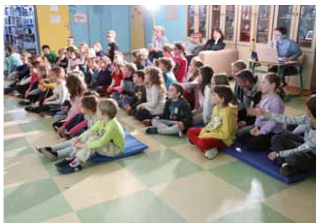
ISOLA: il pubblico attento