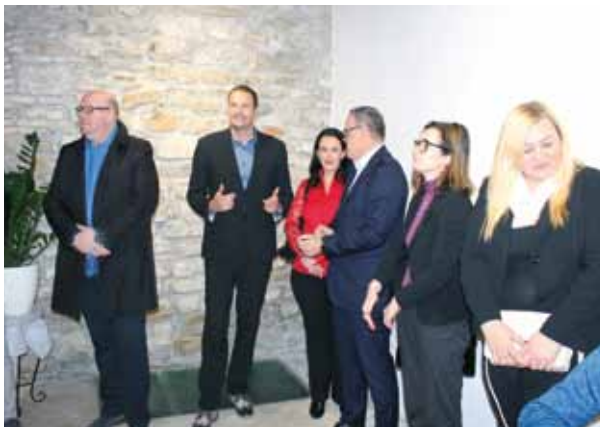
PALAZZO MANZIOLI: La cerimonia di consegna

ristrutturare altre di proprietà comunale, per sistemare i prossimi aventi diritto in base a una precisa lista di criteri, curati dall'apposita commissione, ringraziata per il prezioso lavoro svolto. Ai presenti si è rivolto ancora Denis Bele, direttore dell'azienda municipalizzata Komunalna, che gestisce il fondo alloggi isolano. Ha specificato che gli appartamenti assegnati hanno superfici oscillanti tra i 20 e i 75 metri quadri, ubicati in varie zone di Isola, dal centro storico a Livade. L'affitto costerà dai 47 ai 260 euro.