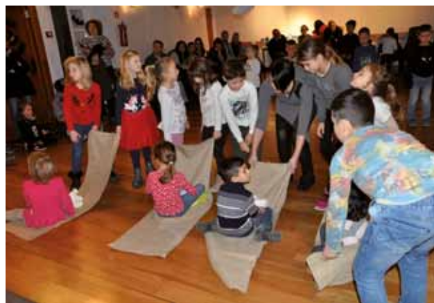
PALAZZO MANZIOLI: Giochi aspettando la Befana

e Chiarastella, il tempo è volato ed è giunto il momento più atteso. Con gli anni la Befana si è guadagnata l'affetto di molti bambini isolani e qualcuno quest'anno ha voluto approfittarne, cercando di rubarle la scena: Babbo Natale. Il più famoso tra le figure che durante le feste distribuiscono doni ai bimbi, ha voluto vivere un altro momento di gloria, però senza successo. L'arzilla vecchietta lo ha immediatamente scacciato e si è dedicata subito ai suoi carissimi fan. Con il suo naso pronunciato, la lunga gonna rattoppata, i