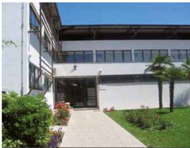
ISOLA: La Scuola Pietro Coppo