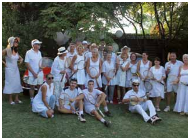
ISOLA: I tennisti vintage