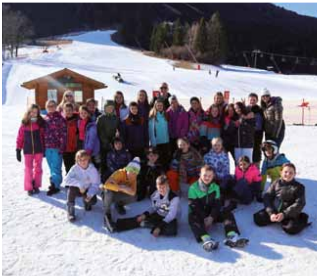
FORNI DI SOPRA: Foto di gruppo