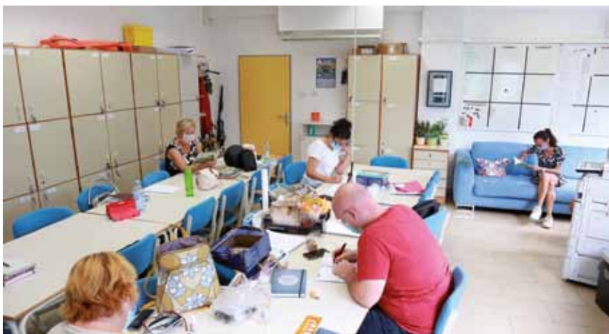
SCUOLA ELEMENTARE: Preparativi in sala insegnanti

tecedenti al primo giorno di scuola, sono concentrati sui preparativi, e per quanto riguarda l'anno scolastico che sta per iniziare la situazione è più complicata a causa dal Covid-19. Negli ultimi giorni, presso il nostro Istituto, si