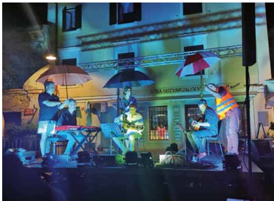
ISOLA: Isola in musica sotto la pioggia