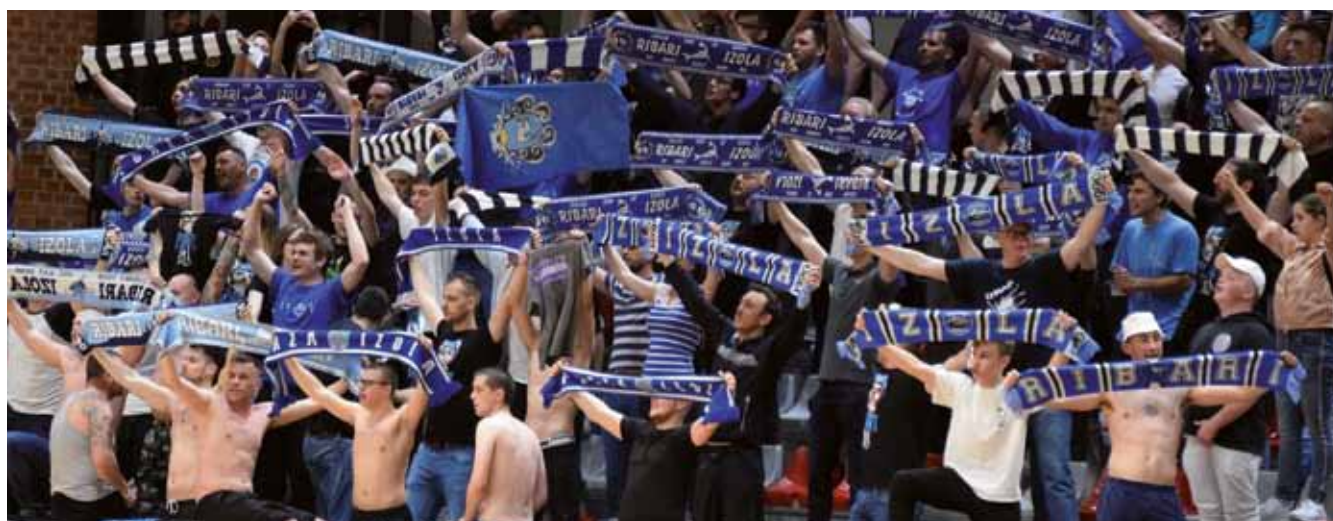
ISOLA: Ribari- tifo indiarvolato