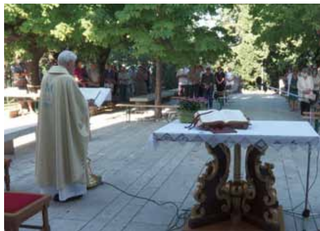
STRUGNANO: I fedeli in pieghera