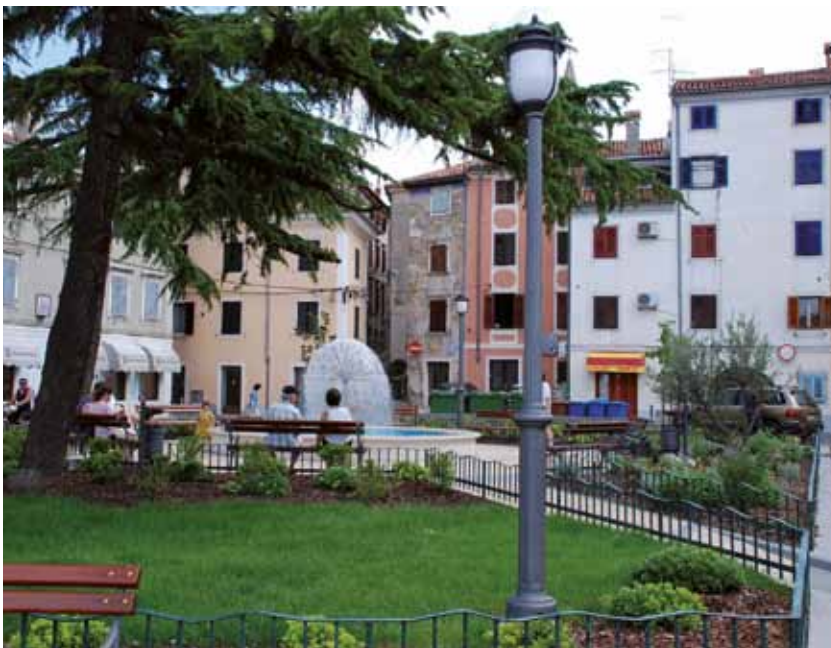
ISOLA: Piazza Grande

Prorogato il divieto di assembramento per più di 10 persone, che possono diventare 50 a eventi dove l'organizzatore ha la lista dei presenti, esegue controlli della temperatura corporea, impone l'uso delle maschere se la distanza tra i presenti è inferiore al metro e mezzo.