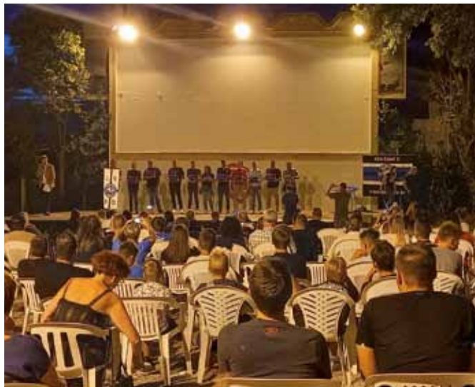
ISOLA: La presentazione del documentario sui Ribari