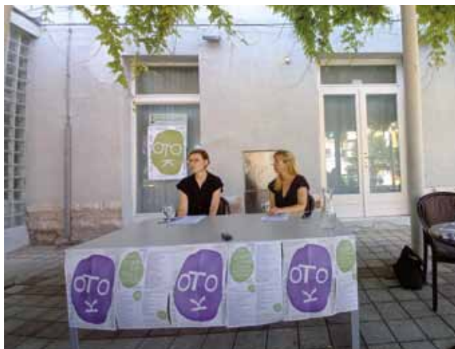
ISOLA: La presentazione dei film