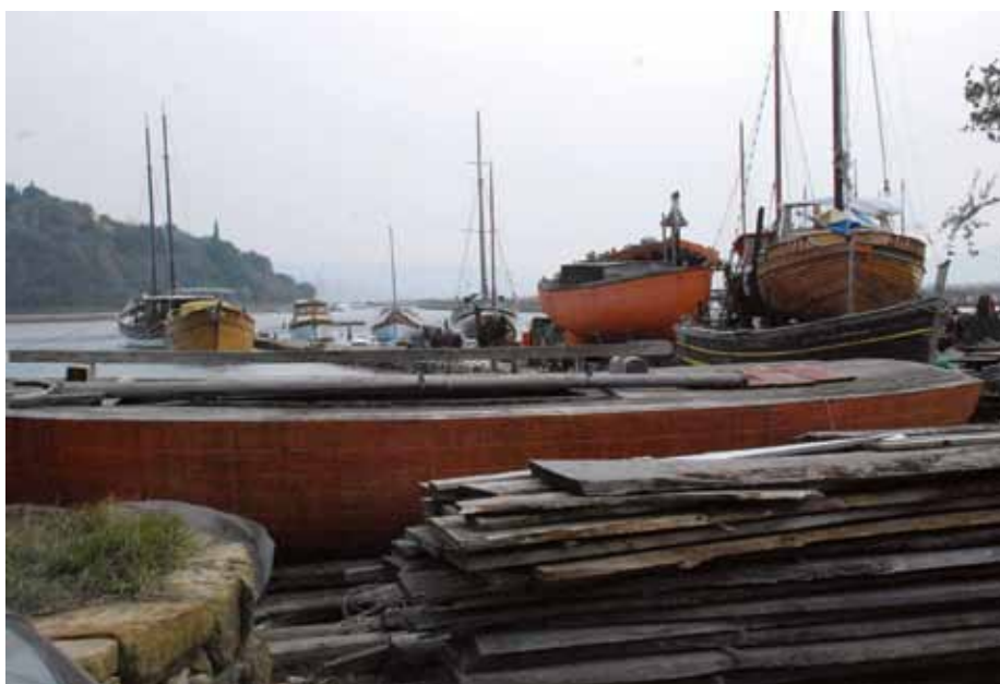
SEZZA: Canale di San Bortolo

simposi dove si cerca di trovare rimedio a quel bruttissimo fenomeno che è il surriscaldamento del nostro pianeta, e portarli non sull'Ararat, ma molto più in alto, da dove si fa difficile il ritorno. Caro Noè, ti ringraziamo anticipatamente.