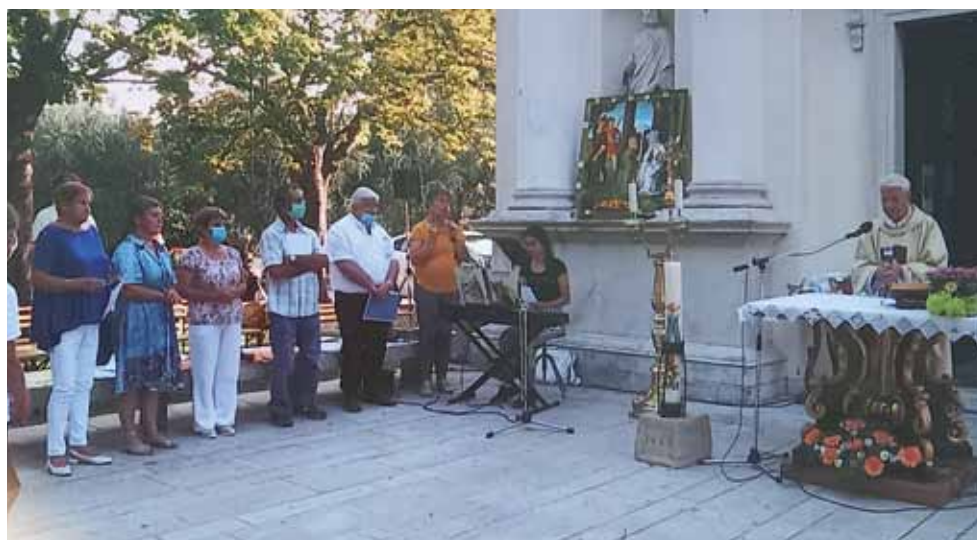
STRUGNANO: La Messa sul sagrato della chiesa