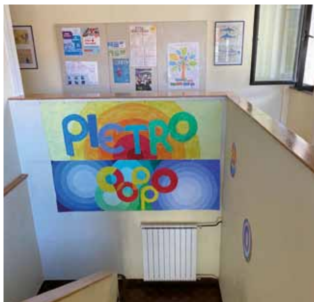
SCUOLA MEDIA: Gli interni della scuola