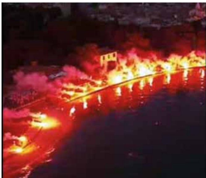
ISOLA: Faccolata per i 30 anni dei Ribari