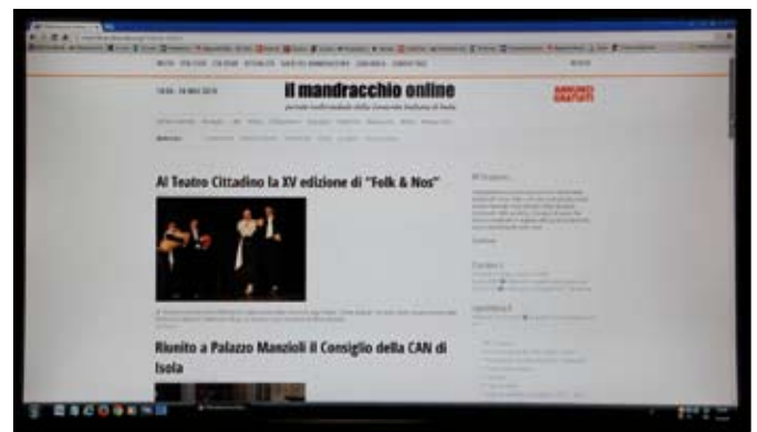
La nuova pagina iniziale del sito della CAN e del portale de "Il Mandracchio"