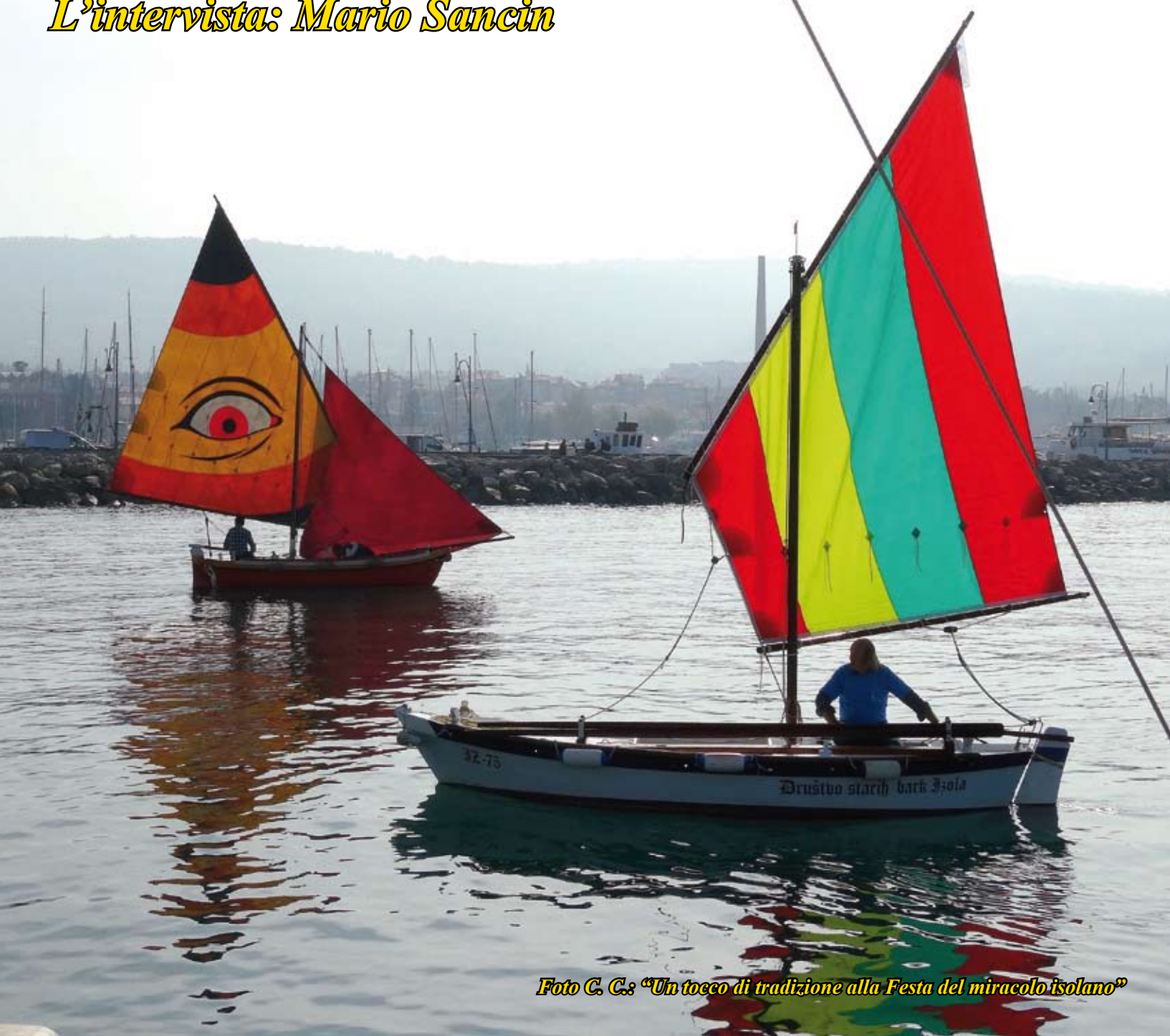
"Un tocco di tradizione alla Festa del miracolo isolano"