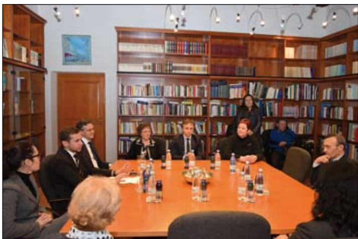
Il Presidente della CAN illustra all'Ambasciatore l'organizzazione politica della CNI a Isola, nonché le attività che si svolgono presso la sede di Palazzo Manzioli