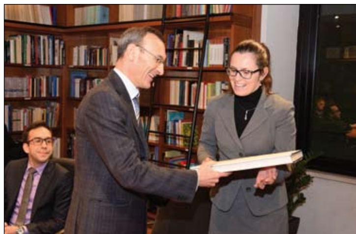
A termine dell'incontro vengono offerti in omaggio le due copie anastatiche dei Codici danteschi e alcune pubblicazioni