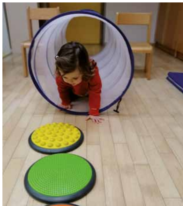
ISOLA: Giochi alla scuola materna