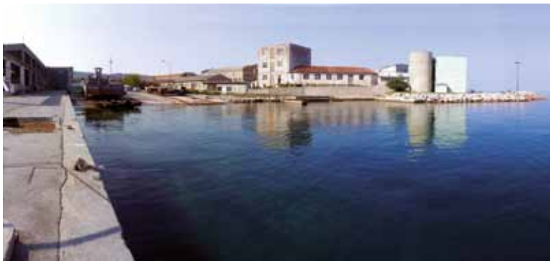
ISOLA: Il comprensorio della ex Delamaris