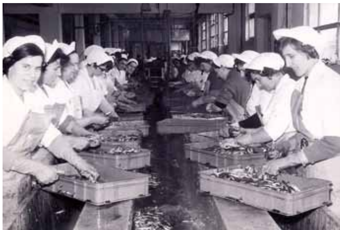
ISOLA: Le operaie della Delamaris in una foto d'archivio