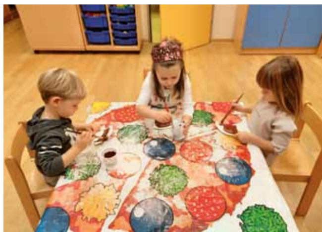
ISOLA: Ora di educazione artistica

ricco di eventi anche se quest'anno sono stati presentati e vissuti diversamente. I bambini insieme alle maestre hanno preparato l'albero di Natale e creato tanti bei disegni e lavoretti che ricordano l'inverno e le sue bellezze. Lunedì 28 dicembre i bambini erano tutti emozionati nel constatare che Babbo Natale era passato in asilo e aveva lasciato sotto l'albero dei grossi sacchi pieni di doni e anche un pacchettino per ciascun bambino, nonché tanti dolci per tutti. Anche la Befana li ha premiati con tante bontà. Nonostante la situazione attuale abbiamo cercato di creare all'interno della scuola materna un mondo di armonia e svago, mettendo al primo posto i desideri più profondi dei bambini e i loro bisogni. Tutto ciò ha permesso di creare un clima spensierato di amicizia e allegria tra i bambini presenti alla scuola materna in queste settimane.