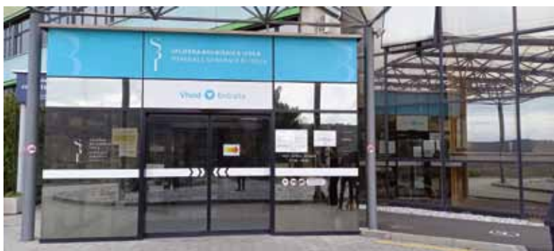
ISOLA: L’entrata dell’Ospedale