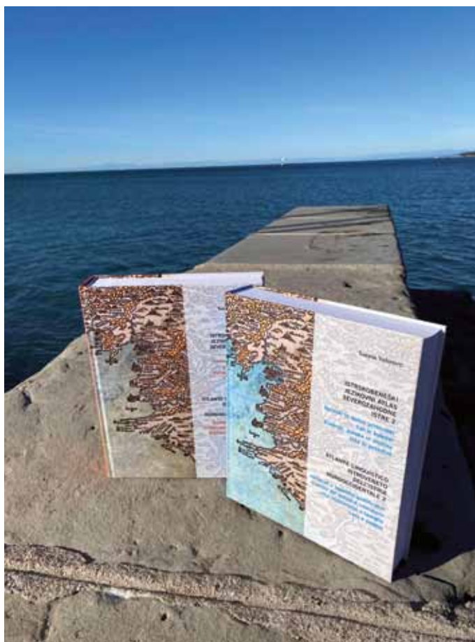
CAPODISTRIA: I due volumi dell'atlante

che gli autoctoni di origini romanze mantengono tutta la loro specifica varietà dialettale locale, che si presenta permeata di particolarità tipiche del vernacolo piranese, quali ad esempio: la desinenza dell'infinito -e per i verbi che in istroveneto formano l'infinito in -er, ad esempio "beve" bere, "ese" essere. È stato rilevato che i parlanti hanno abbandonato determinate espressioni attestate nel dizionario di Vascotto ("grimo" per tirchio, "laveso" per pentola con manico, "mortorio" per funerale, "nembo" per tempesta, "palmento" per pavimento, "recipis" per ricetta ecc.), sostituendo alcune di queste con equivalenti affini di matrice veneta o italiana.