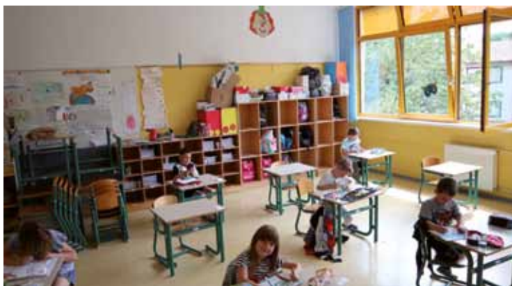
ISOLA: Bambini a scuola

SVIZ, sarebbe stato invece giusto che i test fossero volontari. Si sono detti certi che la maggior parte degli insegnanti avrebbe optato anche volontariamente per il test rapido, consapevoli della loro importanza per limitare la diffusione dei contagi. Forse, però, la prudenza non è mai troppa.