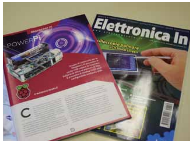
La rivista Elettronica in

Maker Faire di Roma, ha già pubblicato un articolo su un altro progetto della scuola media isolana nel 2019, quando a essere presentata è stata la console di videogiochi vecchia scuola denominata “Coppobuino”. Come spiegato da Škerlič, a richiedere l'articolo sul “PowerPi” è stata la rivista stessa: «Ai redattori e ai lettori piacciono progetti di questo tipo. Attraverso questi articoli didattici che trattano di “cose crude”, i lettori hanno modo di conoscere il procedimento e i trucchi dietro al prodotto finale». “PowerPi” non si potrebbe definire una novità, alimentatori simili esistono già, ma come precisato da Škerlič, il prodotto da loro ideato ha dei vantaggi rispetto a quelli già sul mercato, ovvero le sue dimensioni ridotte (non è più grande di una