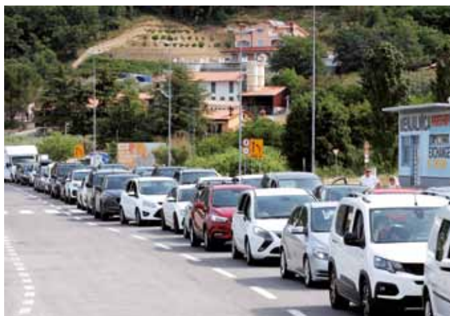
DRAGOGNA: Code al confine con la Croazia

Tutte le notizie legate al Covid sono aggiornate al 28 maggio 2021.