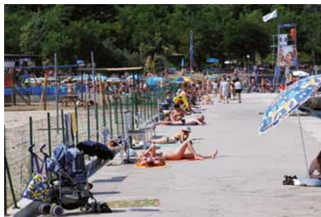
ISOLA: La spiaggia S.Simone