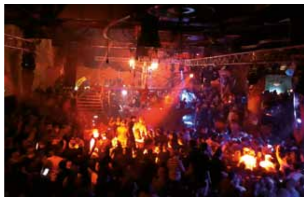
ISOLA: Gli interni della discoteca durante una serata

di impianti karting al coperto sia in Slovenia sia in altri paesi europei, anche oltreoceano. Sui dettagli c'è ancora molto riserbo, la Ensol ha però fatto sapere che era in cerca già da tempo di un immobile per l'espansione dell'attività. La notizia ha suscitato amarezza tra gli appassionati del Gavioli, basti ricordare che quasi tutti gli eventi erano sold out, con visitatori provenienti da svariati Paesi, in particolare da oltreconfine. L'Ambasadà ha vissuto diversi casi di cronaca nera, ma innegabile è stato il suo contributo alla promozione di Isola con introiti importanti per tanti altri servizi, come la ristorazione, gli affittacamere, i trasporti ecc. Nel 2017, quando già si profilava una medesima sorte, si era formata un'iniziativa civile formata da giovani per