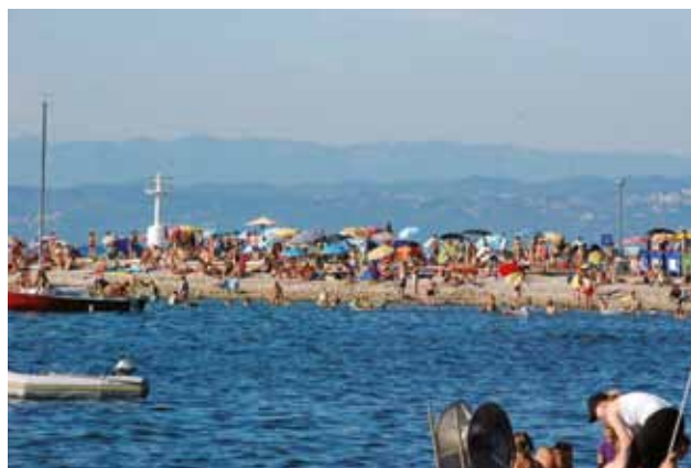
ISOLA: Bagnanti a Punta Gallo in piena stagione

Durante la quindicesima sessione ordinaria del 22 aprile, i consiglieri municipali del Comune di Isola hanno approvato in prima lettura la Proposta di Decreto sull'ordine e sulla quiete pubblici, che è stato inviato ai membri del Consiglio venti giorni prima. Il Decreto fornisce una base giuridica per regolare l'ordine pubblico e prevede sanzioni pecuniarie in caso di violazioni. L'ordinanza, che ha scatenato un dibattito molto acceso sui social media, dovrebbe essere adottata prima della stagione estiva, in quanto andrebbe a regolamentare anche le passeggiate in città in abiti inappropriati, come i costumi da bagno. Il Comune di Isola sentiva la mancanza di un decreto sull'ordine pubblico da ben quattro anni, quando nel 2017 l'ordinanza è scaduta. La Proposta rafforza il concetto di ordine pubblico e di quiete pubblica, infatti vieta di camminare per la città con indu-