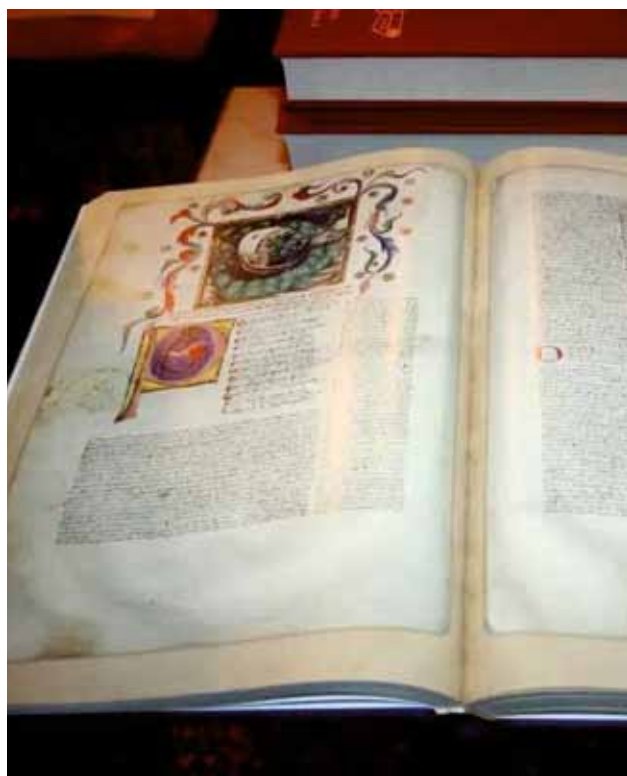
ISOLA: Una copia dei manoscritti