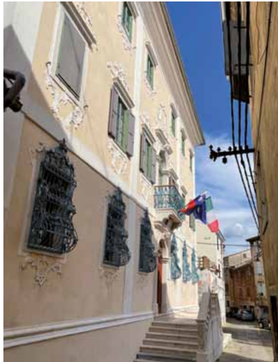
ISOLA: Palazzo Besenghi

gitali è stata realizzata dall'Associazione culturale educativa "PINA" e al momento, per motivi di sicurezza sanitaria non è stata ancora inaugurata