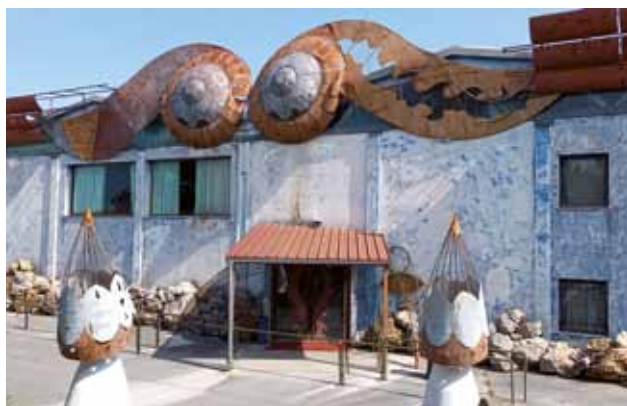
ISOLA: L'entrata del Gavioli