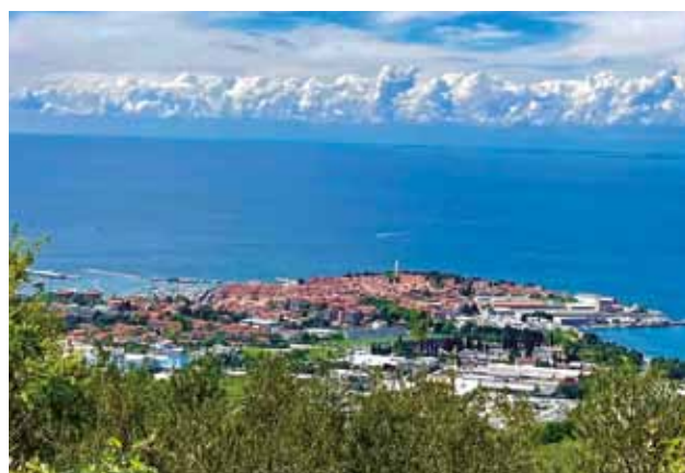
ISOLA: Veduta della città

verde del turismo sloveno 2021. La motivazione recita: "un approccio responsabile e strategico sia nella gestione della destinazione sia nella tutela del patrimonio culturale". È stato particolarmente elogiato il volantino "Visit & Respect Izola", volto a sensibilizzare cittadini, visitatori e fornitori con consigli per comportamenti più responsabili. I valutatori intravedono ulteriori progressi in particolare nella riduzione della quantità di rifiuti solidi e nell'adattamento ai cambiamenti climatici, nonché nell'aumentare la consapevolezza di una maggiore tutela ambientale. Onde invogliare i più curiosi, con l'arrivo della nuova stagione turistica, Isola allarga la propria offerta con esperienze piuttosto