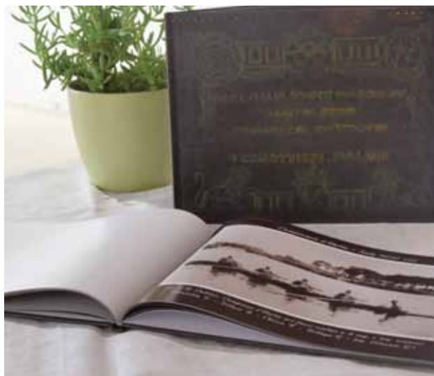
ISOLA: L'Album dedicato alla Pullino