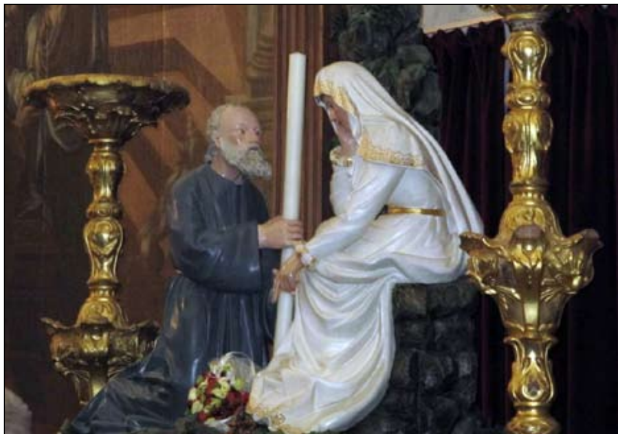
La Beata Vergine della Visione nella chiesa di Strugnano.

Migliaia di persone in pellegrinaggio ogni anno per onorare la Donna Vestita di Bianco apparsa 500 anni fa a Strugnano, anche se non ha mai compiuto miracoli né promesso guarigioni impossibili. Anche gli Isolani, da cinque secoli, due volte all'anno, si recano in visita al Santuario che Lei stessa ha ordinato la notte del 14 agosto 1512.