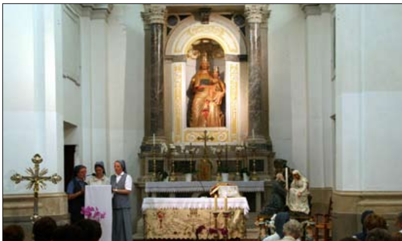
Altare della Chiesa della S. Maria d'Alieto di Isola con la Madonna al centro.

Dopo 65 anni dalla requisizione perpetrata dal regime comunista e vent'anni dopo l'avvento della democrazia in Slovenia, nel 2010, il convento è ritornato di proprietà della Chiesa. Ancora oggi, la parrocchia di S. Maria della Visione, istituita nel 1961, è composta da tre filiali: dalla chiesa di San Basso, che si trovava in prossimità di villa Tartini e che venne demolita nel 1957; dalla Chiesa di San Cristoforo e dalla chiesa di S. Antonio di Padova. Quest'ultima, trasformata dal potere in allevamento di maiali, e poi venduta dal Comune di Pirano.