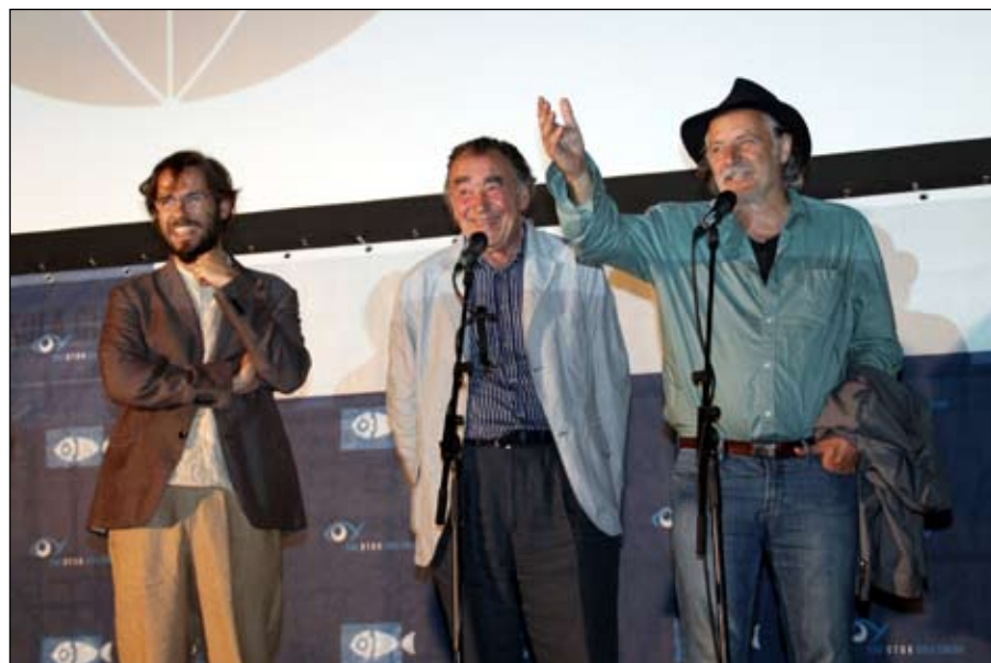
Il regista Andrea Segrè, lo scrittore Milan Rakovac e l'attore Rade Šerbedžija

africani, latinoamericani, medio-orientali, asiatici. Accanto al programma di proiezioni, il festival era arricchito anche da una serie di appuntamenti collaterali: mostre, dibattiti, workshop, concerti. Tra le chicche di questa edizione le pellicole Una vita semplice della regista Ann Hui di Hong Kong, già premiata al Festival di Venezia, il film Il mio nome è Li del documentarista Andrea Segrè, quindi l'ultimo film dei fratelli Taviani, Cesare deve morire , premiato poco prima con l'Orso d'oro 2012 al Festival di Berlino. Da segnalare ancora Raavanan una riflessione sulla realtà politica in India del regista Mani Ratnam, uno dei più conosciuti e apprezzati.