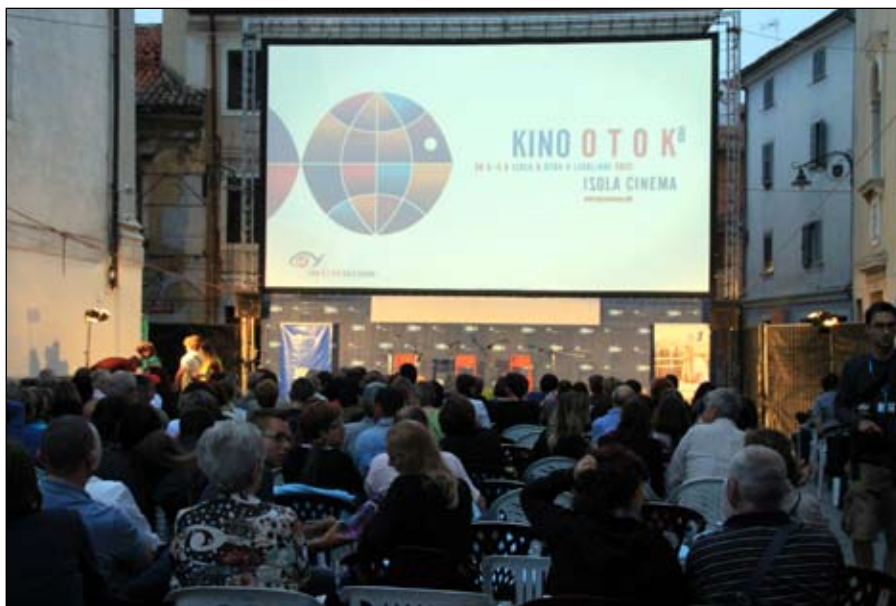
Piazza Manzioli sempre affollata.

Film di qualità e atmosfera strapaesana sono stati gli ingredienti che maggiormente hanno determinato il successo di questa manifestazione. Kino Otok/Isola Cinema nel giro di poche edizioni è diventato uno degli appuntamenti culturali più attesi dell'estate istriana. Le vie e le piazze della suggestiva cittadina mediterranea nei giorni del festival si sono riempite di attori, registi, pubblico, provenienti da vari paesi europei ed extra europei. Con sezioni dedicate alla cinematografia dei diversi continenti sono stati presentati ad un pubblico di affezionati novità e retrospettive di autori e registi