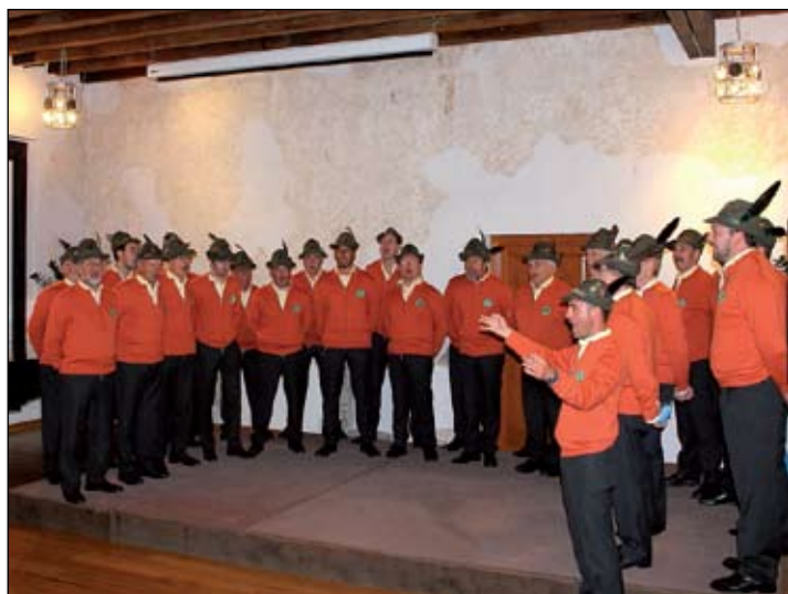
Il Coro sezionale dell'A.N.A. Di Udine – Gruppo di Codroipo.

In occasione della Giornata internazionale dei musei, numerose le iniziative allestite a Isola: al Museo Parenzana, accanto al plastico e alle foto della mitica ferrovia, visita guidata alla raccolta di modellini di imbarcazione locali e proiezione di foto dell'ormai chiusa azienda Mehano; al Parco Archeologico di San Simone, visita guidata al sito della Villa marittima e laboratori didattici per bambini e adulti. (Le tre foto sotto)