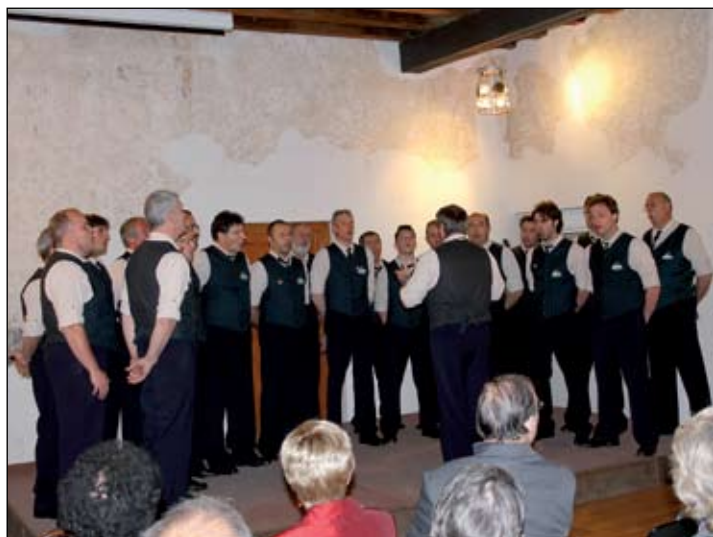
Il Coro "Stella alpina" di Lavarredo (Trento).