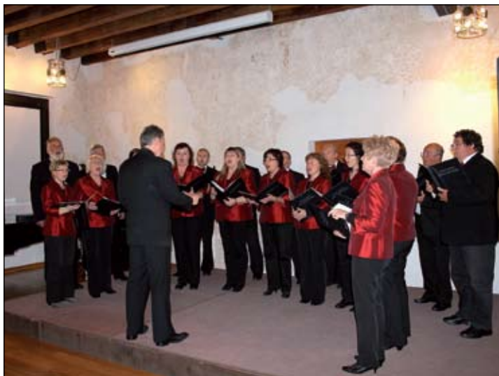
Coro "Haliaetum" della CI P. Besenghi degli Ughi