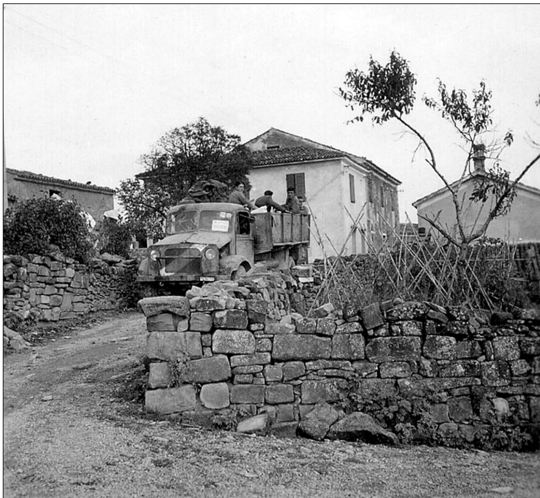
1954. Un'altra famiglia lascia la Zona B nella periferia di Trieste, zona ormai passata alla Jugoslavia.

Gli appartenenti al gruppo etnico jugoslavo nella zona amministrata dall'Italia e gli appartenenti al gruppo etnico italiano nella zona amministrata dalla Jugoslavia saranno liberi di usare la loro lingua nei loro rapporti personali ed ufficiali con le autorità amministrative e giudiziarie delle due zone. Essi avranno il diritto di ricevere risposta nella loro stessa lingua da parte delle autorità; nelle risposte verbali, direttamente o per il tramite di un interprete; nella corrispondenza, almeno una traduzione delle risposte dovrà essere fornita dalle Autorità.