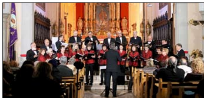
Il coro Haliaetum di Isola.