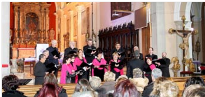
Il coro Harmoniae di Spilimbergo.

Il Duomo di Isola ha ospitato la 26-esima edizione del concerto. Si sono esibiti il Coro polifonico "Harmoniae" di Spilimbergo, l'"Obalca" di Capodistria e l'"Haliaetum" della C.I. Pasquale Besenghi degli Ughi di Isola.