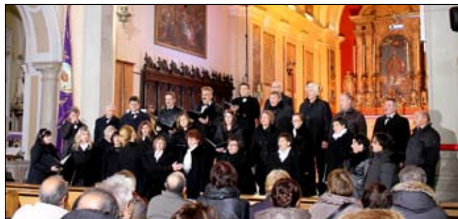
Il coro Obalca di Capodistria.