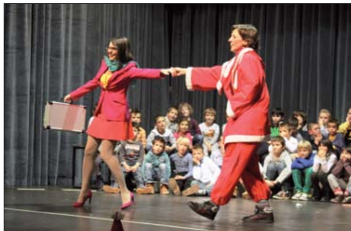
Arriva Babbo Natale: festa della CI Besenghi al teatro di Isola