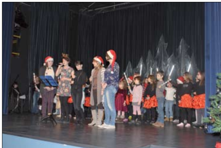
Aspettando Natale con la CI Dante Alighieri