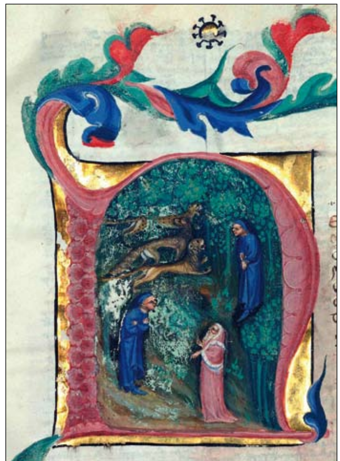
Dettaglio - Nel mezzo del cammin...