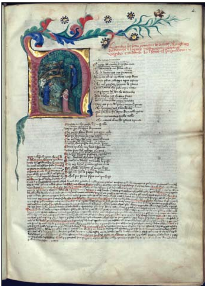
Nel mezzo del cammin...