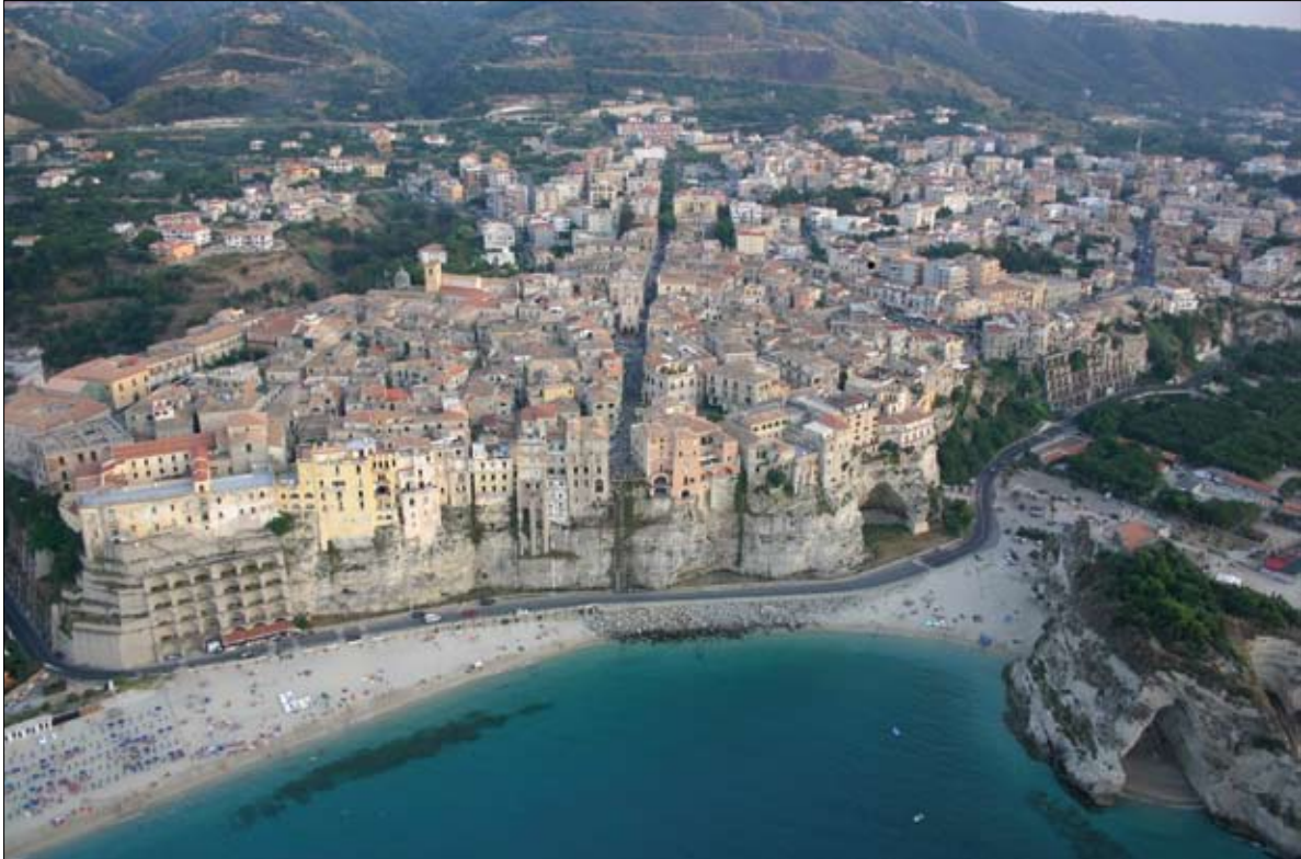
Veduta aerea di Tropea