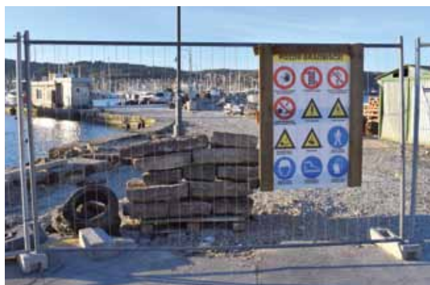
ISOLA: Il cantiere presso la stazione di servizio

La zona portuale di Isola presto risplenderà di una luce tutta nuova. È in pieno corso, infatti, l'ampia opera di ammodernamento delle infrastrutture. Un progetto tanto atteso e necessario quanto ambizioso, che vede la collaborazione del Comune e dell'azienda municipalizzata "Komunala" e il cui costo complessivo ammonta a 3,8 milioni di euro, in gran parte finanziato da risorse europee a fondo perduto. La stesura del progetto è stata affidata all'azienda "ISAN 12" di Capodistria, specializzata nella progettazione di costruzioni marittime, la quale si è già occupata dell'ammodernamento delle darsene capodistriana e piranese. La ristrutturazione è stata suddivisa in due parti. La maggior parte dell'opera è stata inclusa nella prima fase del progetto che vedrà gli appaltatori, la "Grafist" di Capodistria con