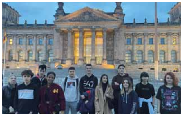
BERLINO: Foto ricordo

hanno deciso di creare dei cortometraggi, un podcast e un prodotto artistico. Il nostro gruppo di alunni era diviso in tre gruppi: - un primo gruppo ha realizzato il video “Food connects people”, nel quale le persone di culture diverse si conoscono sul posto di lavoro e attraverso il cibo si connettono; un altro ha prodotto un cortometraggio dedicato alle diverse tradizioni dei tre stati: Slovenia, Germania e Finlandia, mentre il terzo gruppo si è dedicato alla costruzione di un modello del muro di Berlino e alla scrittura di un tema riguardo alle esperienze vissute dagli abitanti della città. Il modello rappresenta il confine tra i poveri e i ricchi e il tema invece parla di due esperienze vissute dai due poli opposti. Durante le giornate dell'esperienza Erasmus abbiamo anche avuto modo di visitare alcuni luoghi di Berlino: il primo giorno per esempio, quando siamo arrivati, siamo andati a visitare il museo DDR (Democratic