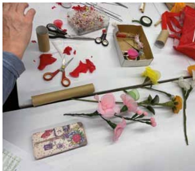
PALAZZO MANZIOLI: Alcune creazioni del gruppo

impegnative e adatte a chiunque. Gli incontri si tengono due volte al mese e dopo quelli di ottobre, sono continuati anche nella prima metà di novembre. Appena gli impegni lavorativi e familiari lo consentono, i soci partecipano volentieri all'incontro e seguono la mentore, che vanta una lunga e ricca esperienza in questo campo. Appassionata di lavori manuali, collabora da una quindicina d'anni con diverse associazioni, che l'hanno arricchita e dove ha acquisito dimestichezza e velocità nella realizzazione di oggetti vari.