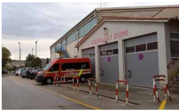
ISOLA: L'attuale sede in Via del Carso