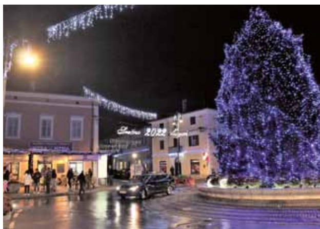
ISOLA: Atmosfera festiva al tempo del Covid

lavoro e anche al nosocomio isolano è possibile vaccinarsi con il preparato Pfizer Biontech. Le elevate richieste, però, sono in prevalenza per le terze dosi, per quelli che si sono vaccinati ormai 6 mesi fa, o anche meno per coloro a cui inizialmente era stato somministrato il preparato AstraZeneca o Johnson&Johnson. Negli ospedali il quadro resta critico. Ci troviamo in una situazione che "non permette" più di ammalarsi in modo grave di altre patologie, perché non ci sono più posti nelle terapie intensive. Gli esperti continuano a ribadire che in caso di incidenti stradali grossi, o infortuni gravi, sarebbe praticamente