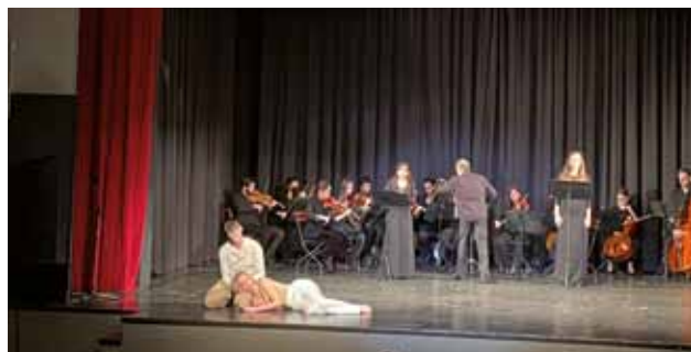
CASA DELLA CULTURA: Una fase dello spettacolo

A fine novembre sono tornati a far visita a Isola gli amici dell'Amadeus Adriatic Orchestra, portando lo spettacolo musicale intitolato "Stabat mater: storia di una madre". Dopo che nel 2020 le restrizioni sanitarie dettate dall'epidemia da Coronavirus, hanno visto saltare il tradizionale appuntamento, questa volta un gruppo più nutrito di musicisti, cantanti e ballerini, si sono esibiti per la prima volta presso la Casa di Cultura. L'evento è stato organizzato dalla Comunità degli Italiani "Dante Alighieri, in collaborazione con l'Associazione Mozart Italia con sede a Trieste (AMITS). Il direttore dell'Orchestra, il Maestro Stefano Sacher, ha precisato che il progetto ha visto la sua prima esecuzione proprio a Isola ed ora è alla terza rappresentazione di quest'anno. I contenuti di tutti e tre gli spettacoli sono stati, comunque, legati al 700.esimo anniversario dalla morte di Dante. Il progetto di giugno ha trattato il