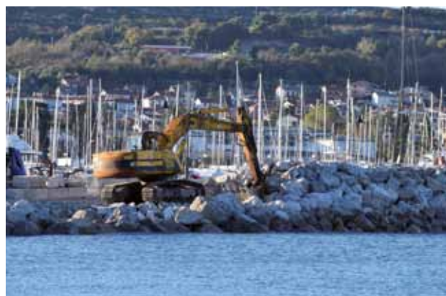
ISOLA: La costruzione del frangiflutti

previsto entro l'inizio dell'estate, si passerà alla seconda che prevede l'ampliamento di quattro metri del lungomare in Riva del Sole, con il quale si ricaverà spazio aggiuntivo per i pedoni, dato che al momento la riva è perlopiù occupata dai tavoli dei limitrofi locali. I punti più bassi della costa verranno, inoltre, innalzati fino a 40 centimetri e nei tratti ancora sprovvisti, tra la strada e la riva, verranno collocate aree verdi. Secondo quanto dichiarato dagli amministratori locali, si tratta di cambiamenti di grande importanza strategica per tutto il Comune. A loro avviso queste novità faranno sì che la cittadina abbia un porto moderno e sicuro per tutti - utenti, abitanti e visitatori. Le esigenze di tutti e tre i profili sono state considerate sin dall'inizio, infatti, già nelle fasi embrionali della progettazione sono stati inviati a