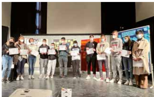
BERLINO: Presentazione dei lavori finali

Dal 4 all'8 ottobre si è svolto a Berlino il primo incontro internazionale del progetto con il tema “Identificazione delle barriere”. Al progetto partecipano tre scuole di tre stati diversi: la Scuola media Pietro Coppo di Isola, la Scuola media Max-Beckmann-Oberschule di Berlino (Germania), la Scuola media Laanilan lukio di Oulu (Finlandia). Al primo meeting hanno partecipato tutti gli alunni che fanno parte del gruppo Erasmus. Durante la settimana noi ragazzi abbiamo avuto modo di conoscere nuove culture e fare nuove amicizie. Il tema principale di questo primo incontro a Berlino era identificare i vari tipi di limiti o barriere che noi individui incontriamo nel corso della vita. La società nei giorni nostri è molto cambiata e con essa anche i ragazzi. Per noi è molto difficile essere accettati se siamo diversi dagli altri per cultura, religione o perché disagiati economicamente. Le società sono state sempre divise, in qualche