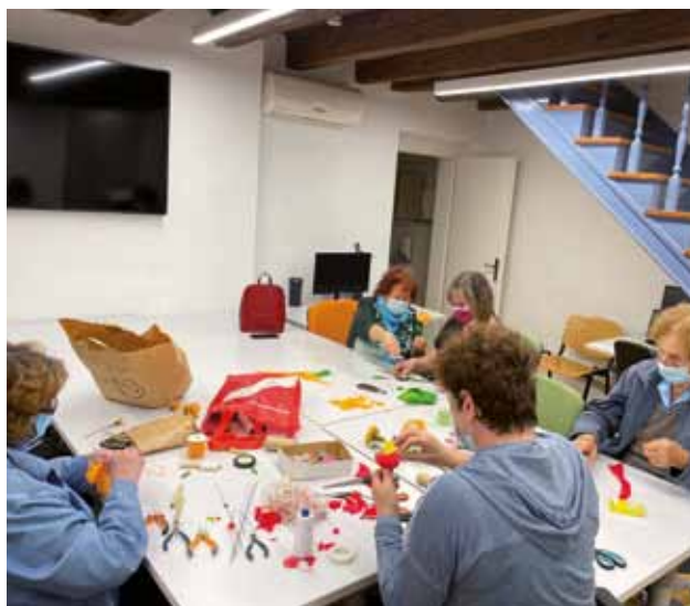
PALAZZO MANZIOLI: Le corsiste in piena attività

Dopo i colorati ciclamini e altri fiori confezionati ad ottobre, nel primo incontro novembrino sono stati realizzati fiori di orchidee, mentre nel secondo delle belle stelle di Natale, in tema con il periodo alle porte.