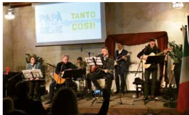
PALAZZO MANZIOLI: Lo spettacolo

co, allestito per l'occasione al pianterreno, dove ad aspettarli c'era il giovane fotografo Nikola Predović, che ha scattato loro una foto ricordo. Questa è stata poi utilizzata per la realizzazione di un lavoretto che i bimbi hanno creato durante il laboratorio artistico, curato da Tjaša Krajcar, aiutata da Tanija Pulin, Vanja Bolčič, Alessia Perič e Gaia Kavalič. A conclusione del concerto i piccoli artisti sono stati invitati in Sala nobile per mostrare al pubblico le loro opere, ovvero una cornice con la scritta “Papà ti voglio bene tanto così!”, corredata di foto, che hanno poi regalato ai propri papà. Entusiasta della serata, il presidente Dassena ha ringraziato gli esecutori per l'ottima riuscita del concerto, sottolineando la propria contentezza nel vedere Palazzo