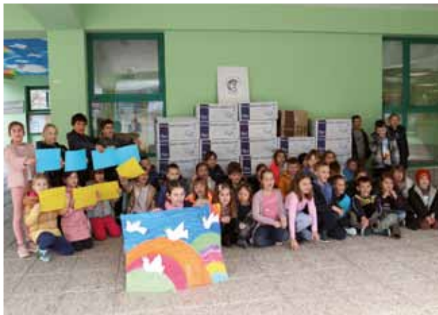
ISOLA: Alunni della Dante Alighieri con gli aiuti per l'Ucraina

Gli insegnanti ne hanno parlato anche durante le ore di le-