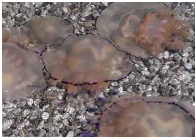
ISOLA: Meduse spiaggiate

Avvistare delle meduse lungo le coste istriane nei mesi freddi è piuttosto usuale. Quanto sta accadendo quest'anno è, invece, un fenomeno preoccupante, che rasenta la calamità naturale. Banchi interi hanno occupato le nostre acque. Le protagoniste degli avvistamenti sono le meduse più grandi dei nostri mari, le Rhizostoma pulmo, chiamate comunemente "Polmone di mare". Di color rosa-violaceo, nuotano pigramente nelle insenature