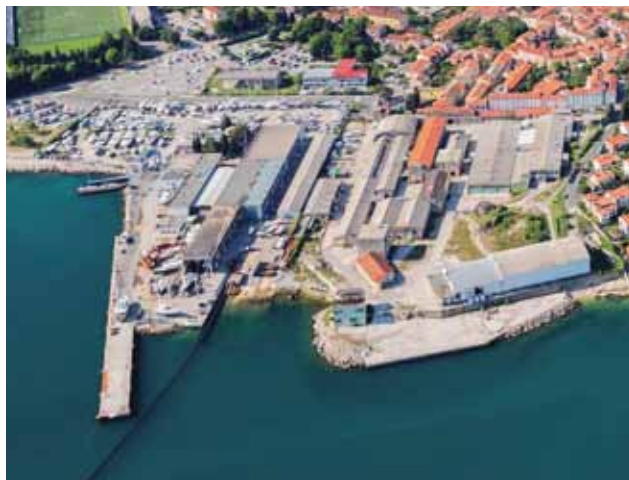
ISOLA: L'ex cantiere navale