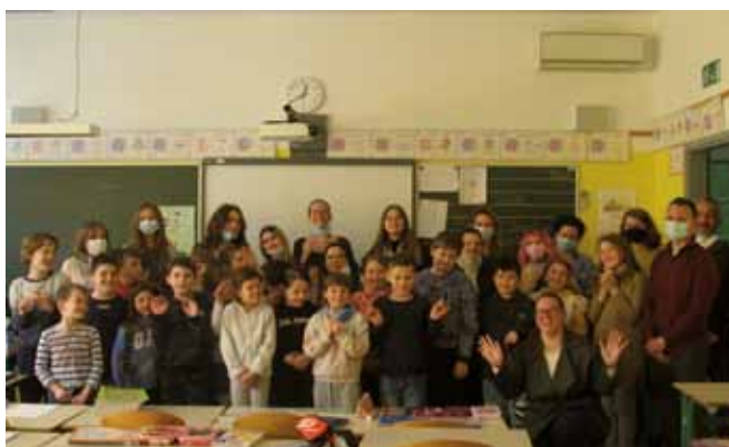
ISOLA: EDUCOM Foto ricordo

Le partecipazioni degli insegnanti ai progetti portano all'arricchimento delle conoscenze dei docenti, alle nuove esperienze professionali e allo scambio di idee e metodi lavorativi. Inoltre, dando spazio agli alunni, anche loro hanno avuto modo di interagire e di comunicare con i partner ospitati. Questi ultimi hanno affermato che porteranno a casa con sé nuovi metodi e tecniche di lavoro che potranno implementare nel proprio campo lavorativo con i propri bambini che necessitano aiuto.