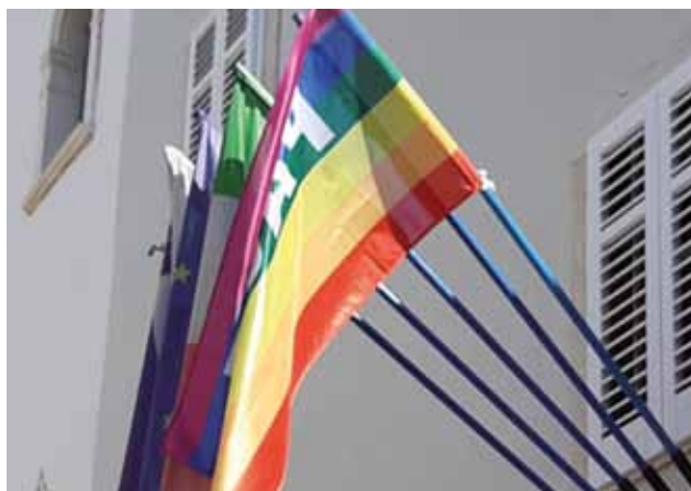
ISOLA: La bandiera della pace a Palazzo Manzioli

Esprimiamo, in questo modo, la nostra solidarietà e vicinanza a tutti gli ucraini ed ai popoli innocenti coinvolti nei conflitti in corso, sia in Europa sia nel mondo, con l'auspicio che le ostilità abbiano presto a cessare, per il bene dei Paesi coinvolti e dell'intera Comuni-