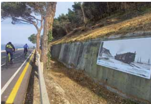
ISOLA: La Parenzana ricordata sulla strada costiera