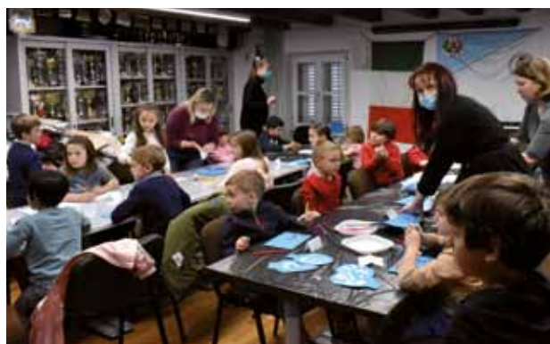
PALAZZO MANZIOLI: Laboratorio creativo

Il gruppo “Pane e Refosco”, attivo in seno alla Comunità degli Italiani “Dante Alighieri”, dopo due anni, condizionati dalla pandemia, è tornato a festeggiare San Giuseppe, ossia la Festa del papà,