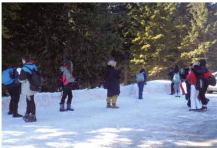
ROGLA: Giochi e scherzi sulla neve

Quest'ultimi hanno imboccato il sentiero tra i boschi: una camminata su una struttura di legno, che si trova a circa 20 metri dal suolo e dalla quale si può ammirare un panorama mozzafiato del Pohorje e della Rogla. Il tragitto è lungo mille metri e durante il percorso si sale anche su una torre, dalla quale si può scendere con lo scivolo. Dopo la camminata era già giun-