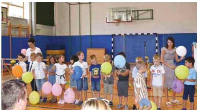
ISOLA: I bimbi della prima classe

mincia la prima classe, è un momento importantissimo e una porta che si apre su un percorso totalmente, nuovo un viaggio lunghissimo, che al primo momento può fare un po' paura, ma poi si rivela un prezioso tesoro di vita e di esperienze da cui imparare e soffrire, gioire, piangere, cadere e rialzarsi. Se riuscirete a percorrere questa strada insieme uniti, se imparerete a collaborare, se capirete l'importanza del rispetto e dell'amicizia, vi assicuro che potrete superare facilmente qualunque difficoltà incontrerete" ha rilevato la preside. Ad uno ad uno i discenti, qualcuno più disinvolto