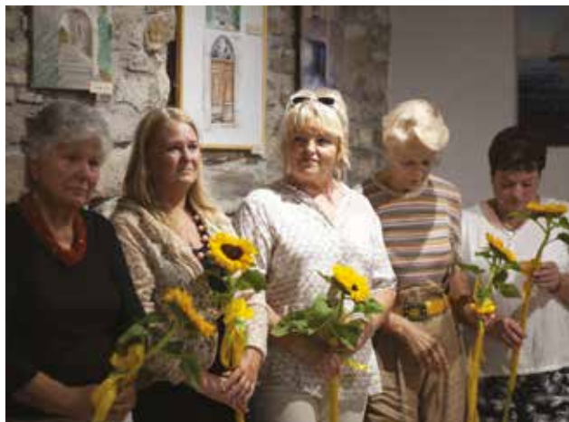
PALAZZO MANZIOLI: Le allieve de La Macia

Il gruppo "La Macia" è composto da diverse apprendiste, che desiderano ampliare la propria conoscenza della pittura, dei colori e delle diverse tecniche come l'uso dei acquerelli o degli acrilici. Durante l'anno il gruppo svolge vari incontri ed escursioni dove le partecipanti scoprono diversi panorami o posti e poi li ricreano usando numerosi colori e tanta fantasia.