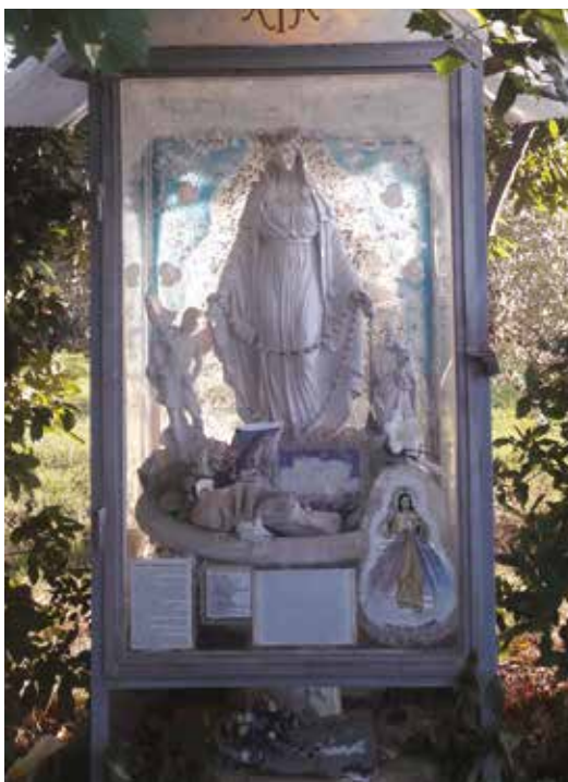
ISOLA: La statua della Madonna del Loreto

8 settembre: per alcuni isolani conazionali, soprattutto per quelli più anziani, questa è giornata dai tanti significati: si celebra la natività della Beata Vergine Maria, da noi nota come “Madona picia” con appuntamento per la messa in lingua italiana nella chiesetta di Loreto, nel rione di Jagodje – Dobrava. Così è stato anche quest’anno, con una maggiore presenza di fedeli rispetto al 2021 e 2022 perché finalmente liberi dalle misure anticovid. “Tuttavia l’affluenza è nettamente inferiore rispetto a tanti anni fa, quando eravamo giovani. Venivamo qui in pellegrinaggio per poi unirci nella preghiera durante la messa, ma per noi era anche una festa perché alla fine del rito religioso si faceva uno spuntino con i cibi di stagione ringraziando il Signore per il raccolto. La ricordiamo anche come un’occasione per stare assieme e discorrere del più e del meno. Sentiamo tanta nostalgia perché questa festività religiosa si univa alle nostre tradizioni. È quanto vogliamo fare anche oggi, ma purtroppo siamo rimasti in pochi, molti isolani ci hanno purtroppo lasciati o sono troppo anziani per muoversi. Riponiamo speranze nei giovani affinché non si perda questa usanza, a noi così cara” – hanno dichiarato i fedeli -perlopiù esuli residenti a Trieste- alle telecamere di TV Capodistria, a margine