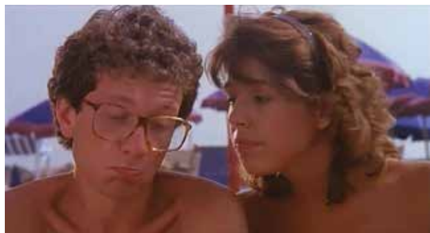
PALAZZO MANZIOLI: Una scena del film

mento serve per donare alla comunità leggerezza, positività, sorrisi e l'occasione per stare insieme. Prima della pausa estiva e come conclusione dello scorso "anno cinematografico" i partecipanti hanno potuto infatti esprimere le loro preferenze e discutere insieme sui film da programmare. Il confronto ha fatto emergere quanto la richiesta comune riguarda la leggerezza: film divertenti, che mettano allegria e che diano speranza. Un'altra delle caratteristiche che rendono il cineforum un momento di inclusione, riguarda il fatto che si scelgano film per tutti, siano essi moderni o più datati, film leggeri o classici dei cineasti. La scelta punta al gusto intergenerazionale, che faccia convogliare il gusto dei