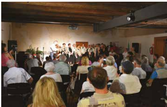
PALAZZO MANZIOLI: Il pubblico alla rassegna folk