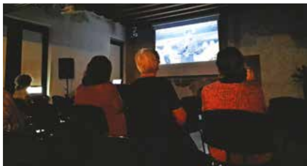
PALAZZO MANZIOLI: Durante la proiezione in Sala Nobile

Il mese di settembre, oltre a un po' di freschezza, porta con sé l'inizio delle attività di Palazzo Manzioli. Tra queste, vi è il tradizionale cineforum organizzato dalla CI Pasquale Besenghi degli Ughi di Isola, che si svolgerà anche quest'anno con cadenza mensile. Per la prima serata, tenutasi mercoledì 13 settembre, è stato scelto "Sapore di mare 2 - un anno dopo", sequel dell'ultimo film proiettato lo scorso giugno. Il film, con la regia di Bruno Cortini e la sceneggiatura dei fratelli Carlo ed Enzo Vanzina, è stato girato nel 1983 a Forte dei Marmi e a Ostia Lido, in Toscana. Ambientato negli anni '60, racconta le vicissitudini di giovani provenienti da diverse città italiane, alle prese con questioni d'amore, di