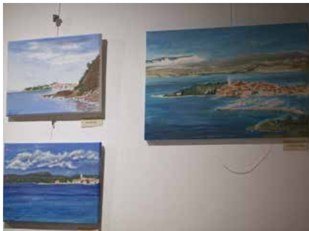
PALAZZO MANZIOLI: Alcuni dei quadri esposti

"Il gruppo artistico "La Macia" è unico e speciale per tutti noi, le corsiste sono molto brave e sono sicuro che continueranno a fare un ottimo lavoro", ha commentato