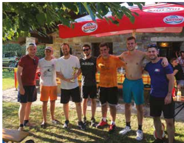
DRAGOGNA: I vincitori del torneo

non ha avuto tanto lavoro, in quanto il torneo di pallavolo si è svolto alla grande, senza incidenti. A partecipare al torneo di quest'anno sono stati giocatori con background piuttosto diversi: infatti, vi hanno partecipato sia "esperti" pallavolisti che ormai praticano la pallavolo da anni sia quelli meno esperti, ma comunque molto motivati e legati da un forte spirito di squadra. Nonostante il torneo sia di natura amatoriale, ricordiamo che si tratta comunque di una competizione, cosa che ha motivato ulteriormente i giocatori a dare il meglio di sé in modo da poter portare