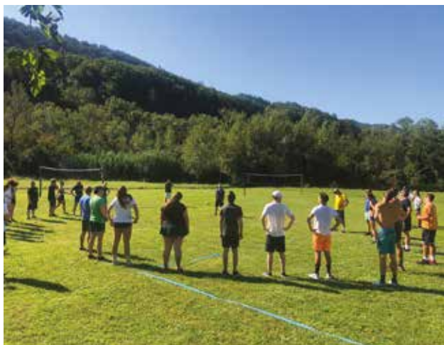
DRAGOGNA: Il riscaldamento iniziale

Il 9 settembre 2023 è stata organizzata la IV edizione del torneo di pallavolo "Green Volley", che ogni anno viene organizzata nella pittoresca Valle del fiume Dragogna. A promuoverla sono stati l'Associazione dei giovani della CNI in collaborazione con il settore giovanile dell'Unione Italiana. L'obiettivo principale di quest'evento era quello di organizzare una giornata di carattere sportivo per tutti gli amanti dello sport che desiderano passare un pomeriggio in compagnia e nel bel mezzo della natura. Ad essere invitate all'evento sono state in primis le Comunità degli