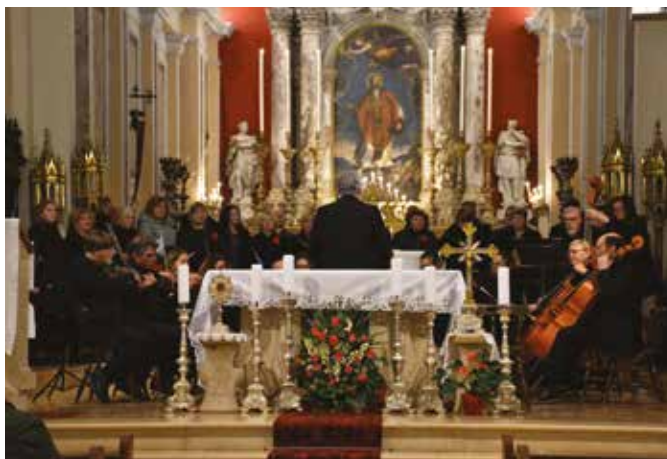
DUOMO DI SAN MAURO: I due gruppi riuniti