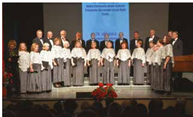
ISOLA: Il Coro Haliaetum