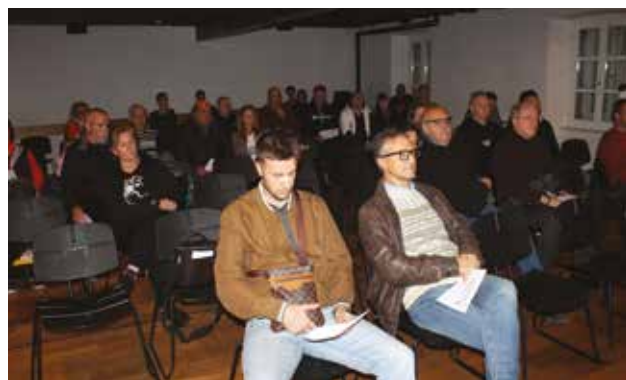
PALAZZO MANZIOLI: Soci della Dante riuniti

mezzo per mezzo nel 2023. Hanno riguardato laboratori per i più piccoli, esibizioni su vari palchi dei cantanti di musica classica e leggera, laboratori creativi, le partecipazioni alle manifestazioni dell'Unione Italiana, dove tra l'altro la Dante ha vinto il medagliere dei Giochi di Parenzo. Rimarcata la presenza nel comparto culturale, con principalmente il Festival dell'Istrovneto e del suo concorso canoro Dimela cantando, dove Gianni Pellegrini ha vinto una delle serate. Per il 2024 sono stati annunciati più momenti aggregativi in sede ed escursioni in luoghi interessanti. Saranno riproposte le sezioni già esistenti, con l'aggiunta del progetto per la musica digitale, un corso di cucito e di lavori pratici. La realizzazione dipenderà, come sempre accade, dai mezzi