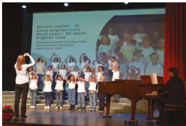
ISOLA: I giovani cantori della SE Dante Alighieri

L'ultima domenica di novembre ha riunito presso la Casa di Cultura di Isola gli amanti del canto corale. La "Serata dedicata alla canzone" organizzata dalla sezione regionale del Fondo pubblico per le attività culturali in collaborazione con il Centro per la cultura, lo sport e le manifestazioni e con il sostegno del Comune di Isola, ha visto tra l'altro la presenza della figura professionale nel settore di Walter Lo Nigro. Isola vanta una lunga tradizione legata al canto e alla musica, per cui non è un caso che ad oggi vi operano una decina di gruppi vocali. Per questo motivo, la rassegna è stata divisa in due parti, ma ad aprire il programma sono stati degli ospiti molto graditi dal pubblico, i Giovani Cantori della Scuola elementare "Dante Alighieri". Il gruppo attivo in questa formazione da due anni, è composto da