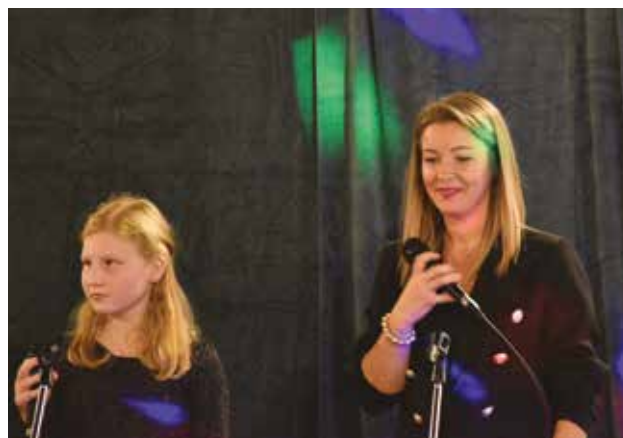
PALAZZO MANZIOLI: La presidente Zonta con un allieva

del 1986 del cartone animato "Memole dolce memole" di Cristina D'Avena, "Il caffè della peppina" dello Zecchino d'Oro del 1971 e "Mamma Tutto" di Iva Zanicchi del 1976. Molto più recenti sono stati i brani "Supereroi" di Mr Rain, classificato al terzo posto al Festival di Sanremo dello scorso anno, i tormentoni del 2023 "Vetri neri" di Anna e Capo Plaza, "Disco Paradise" di Fedez, Annalisa e