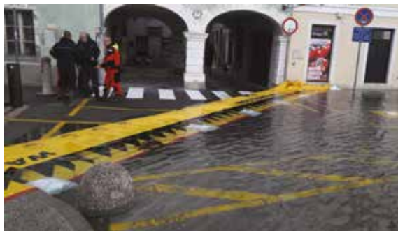
ISOLA: Barriere anti allagamento in Piazza Grande