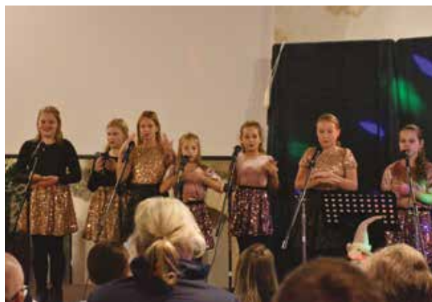
PALAZZO MANZIOLI: Minicantanti in scena