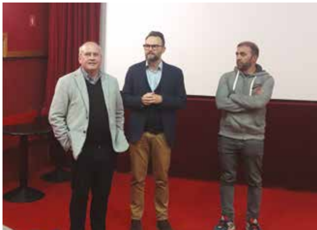
ISOLA: Il dibattito dopo il film