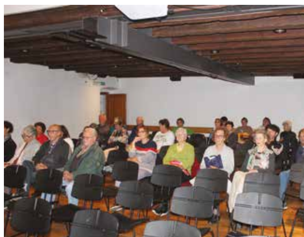
PALAZZO MANZIOLI: L'assemblea dei soci riunita