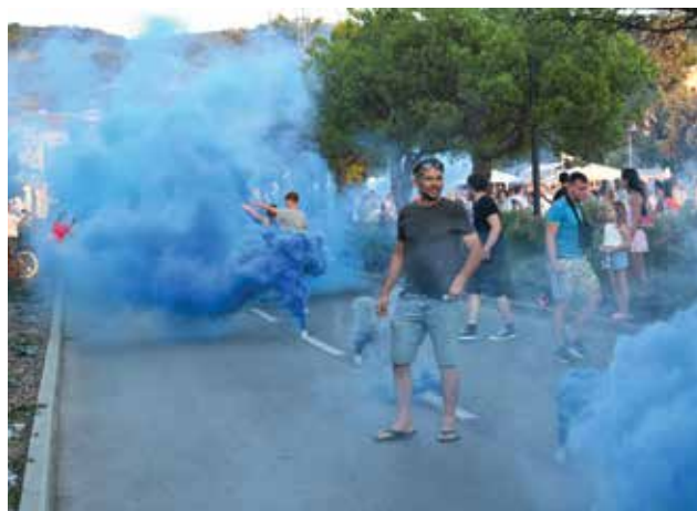
ISOLA: Nubi blu in Riva del sole

Per festeggiare il 35esimo d'attività l'associazione dei supporter sportivi isolani "Ribari" hanno avvolto la città del suo colore, il blu. Centinaia di tifosi, si sono disposti lungo il perimetro cittadino "armati" di fumogeni turchesi. Al segnale convenzionato, due razzi di segnalazione rossi sparati dal molo centrale, hanno attivato la cortina di fumo, completata con fuochi d'artificio, inni allo sport isolano e tanta allegria, nonostante le loro squadre militino in campionati minori e non vi sia grande spazio per l'ottimismo nemmeno nell'immediato futuro.