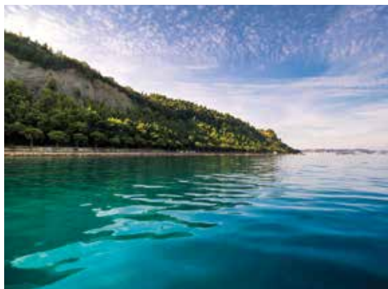
ISOLA: Zona di mare verso Capodistria

Dal mese scorso è in corso la mappatura dei fondali marini nella zona costiera tra il campeggio Jadranka di Isola e la zona balneare di Giusterna alle porte di Capodistria. Il Ministero dell'Agricoltura, delle Foreste e dell'Alimentazione ha commissionato la creazione di mappe con un elenco dei tipi di habitat, principalmente praterie marine e organismi marini tipici. Ha collaborato con il Comune di Isola e il suo Istituto pubblico per la promozione dell'imprenditorialità e dei progetti di sviluppo (JZP). La mappatura dei tipi di habitat e delle specie nella zona costiera di 100 metri di larghezza, costituirà una delle basi specialistiche per lo sviluppo sostenibile e uniforme dell'area tra Isola e Capodistria e la sua successiva gestione. Allo stesso tempo, servirà da base per la realizzazione di nuovi accessi al mare lungo l'ex strada costiera, in modo tale che la nuova infrastruttura abbia il minimo impatto negativo possibile sulla vita marina. La mappatura si svolgerà fino al 30 gennaio 2027 e la maggior parte del lavoro sul campo sarà svolta durante la stagione estiva di quest'anno e della prossima, poiché tali lavori sono più adatti alla stagione calda. L'appaltatore è la