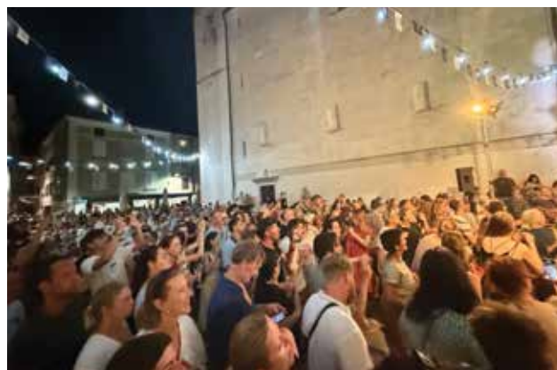
PIAZZA MANZIOLI: La piazza gremita di gente