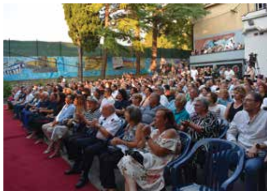
ISOLA: Il pubblico al parco Arrigoni