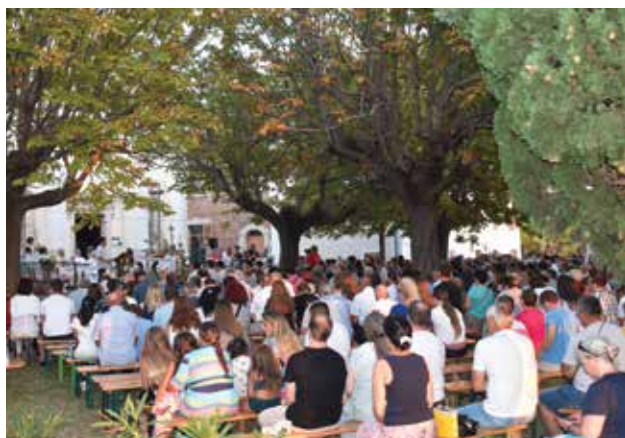
STRUGNANO: Pellegrini presso la Chiesa

a dodici stelle, riproposta tra scultura e dipinto, ha fatto da richiamo ad essere la "nostra stella polare e guida", omaggio e valore aggiunto nel ricordo dell'apparizione che - secondo la leggenda - avvenne la notte del 14 agosto 1512 proprio tra i vigneti che caratterizzavano questo sentito luogo di culto. A seguire, la processione alla Croce per impartire la benedizione al mare, marinai e pescatori, uomini e anime che hanno dato la vita per le azzurre onde, è stato il preludio alla nottata di preghiera organizzata dalla diocesi di Strugnano. La due giorni liturgica si è conclusa venerdì, 15 agosto, con