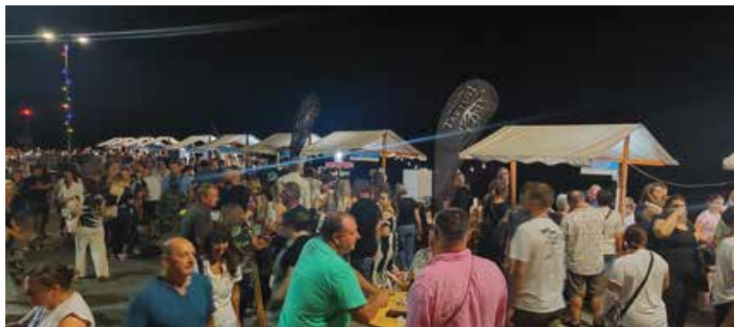
ISOLA: Festa dei pescatori