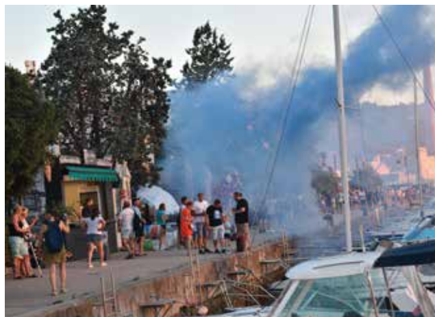
ISOLA: Fumogeni e festa sulla Strada per San Simon

Correva l'anno 1990 e lo sport sloveno iniziava il suo cammino indipendente, dopo lo sfaldamento della Jugoslavia. In campo calcistico i club si affacciavano all'Europa. Nel 1993 tra loro c'era anche l'Isola calcio, gloriosa società fondata oltre 120 anni fa. Per la partita di qualificazione alla Coppa UEFA contro il leggendario Benfica di Eusebio, lo stadio cittadino assunse un aspetto sontuoso: nuovo manto erboso, ma soprattutto tribune numerate. Sugli spalti c'erano già loro: i tifosi isolani che si erano imposti il nome di Ribari, o pescatori pe rifarsi alle antiche tradizioni locali.