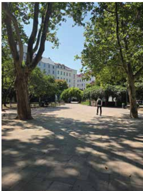
VIENNA: La Nagl platz

panche stavamo godendoci il venticello estivo che ha caratterizzato questi ultimi due mesi nella capitale austriaca: Kardinal-Nagl-Platz. Il nome ci ha subito catturati. Nagel in tedesco significa "unghia". Il cardinale Unghia, abbiamo riso. Nato a Vienna nel 1855, Franz Xaver Nagl studiò teologia a St. Pölten, dove conseguì il dottorato, prima di diventare direttore spirituale del Frintaneum, un istituto di formazione per sacerdoti nella capitale dell'Impero Asburgico. Dal 14 marzo 1889 fu invece rettore del collegio sacerdotale Santa Maria dell'Anima a Roma, carica che rivestì fino al 1902, anno in cui fu eletto vescovo di Trieste e Capodistria. L'elezione avvenne il 2 giugno, mentre la consacrazione il 15, nella stessa Chiesa di Santa Maria dell'Anima dove aveva svolto il servizio di rettore del collegio.