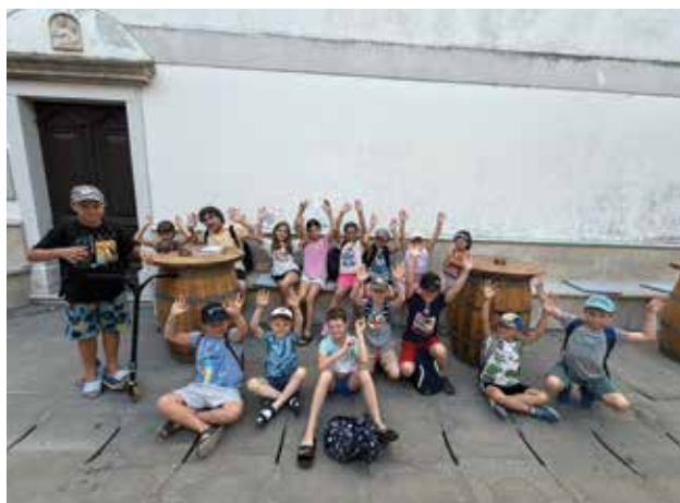
PIAZZA MANZIOLI: Foto di gruppo dei partecipanti