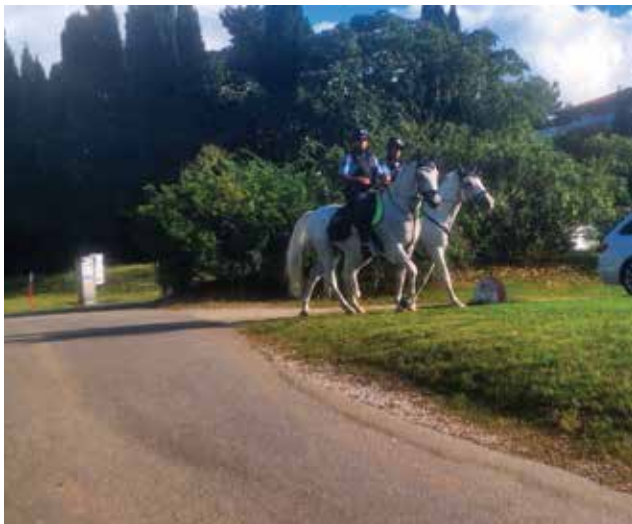
ISOLA: Polizia a cavallo a San Simon

Con la ripresa delle scuole il periodo delle vacanze e “l’alta stagione” turistica come si diceva un tempo, prendono congedo. Gli operatori turistici isolani possono definirsi soddisfatti dei risultati fin qui conseguiti con un aumento pari al 12 % dei soggiorni e pernottamenti, con le strutture ricettive quasi piene nei periodi di punta. A farla da padrone tra i villeggianti sono stati ancora quelli di casa, che hanno decretato Isola come una delle destinazioni più belle sull’Adriatico. Per quanto riguarda gli stranieri sono in netto aumento quelli di lingua tedesca, quelli della Repubblica Ceca e dell’Ungheria. In ripresa, ma ancora indietro in graduatoria, gli italiani. Il Comune e la sua associazione turistica si sono prodigati per