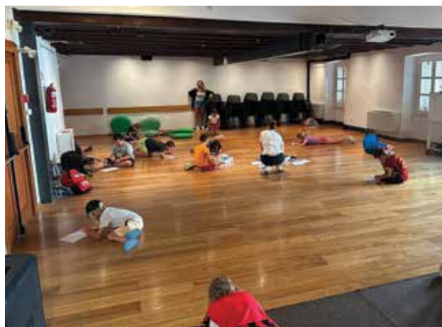
PALAZZO MANZIOLI: I bimbi durante una delle attività proposte

questa la novità in format rispetto agli anni precedenti dove un'unica settimana era dedicata agli interessi pratici, mentre le altre offrivano solo assistenza". Molte le alternative di nuova forgia che quest'anno, oltre all'arte, hanno regalato musica, robotica-lego, erboristeria, cucina, ballo, tour e lunghe passeggiate condite da spensieratezza, tanto gioco e divertimento. Dal 30 giugno al 25 luglio, i pacchetti hanno inglobato dal movimento allo sport con la "puntata" al mare dedicata al nuoto, integrando letture, gastronomia e tanto altro ancora che ha attirato dai 10 ai 15 giovanissimi per volta. L'educativo svago, con tanti momenti all'aperto, ha affidato a singoli mentori e collaboratori esterni l'occasione di trasmettere sapere nell'accattivante che ha coinvolto