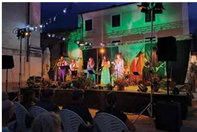
ISOLA: Gli esecutori sul palco