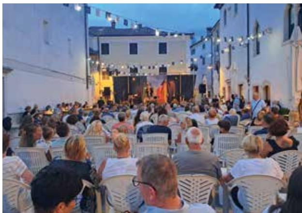
ISOLA: Il pubblico a Piazza Manzioli

anche da due violenze sessuali, concluse con due gravidanze prima del quattordicesimo compleanno. Nel corso degli anni Cinquanta, tuttavia, la cantante ha anche i primi contatti con il mondo discografico. In quel periodo firmò un contratto con la Columbia, che però le impose uno stile pop non adatto a valorizzare la sua voce. Il successo arrivò più tardi, con la svolta soul e brani che avrebbero cambiato la storia della musica, come "Respect", "Think", "I Say a Little Prayer" e "Natural Woman". Con la sua voce unica, intensa e riconoscibile, Aretha ha davvero attraversato decenni di storia musicale e sociale, diventando il simbolo di una generazione