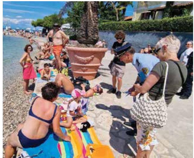
ISOLA: Bagnanti e polizia in visita

la città (come fatto a Pirano e Portorose) per documentare eventuali rumori esagerati. Non ritenuti opportuni maggiori controlli delle guardie municipali, mentre la polizia ha continuato a svolgere il suo regolare lavoro. La stradale ha avuto, purtroppo, molto da fare con le 69 vittime di incidenti stradali finora nel 2025, raggiungendo la tragica quota di tutto lo scorso anno. Non sono mancate le segnalazioni per atti di teppismo e di violenza privata. Anche alla Festa dei pescatori ci chi invece di divertirsi ha alzato le mani contro il servizio d’ordine. Le forze dell’ordine hanno fatto appello alla prudenza per i furti in spiaggia e negli appartamenti affittati ai turisti. Topi estivi sono comunque entrati spesso in