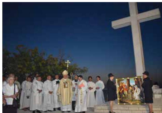
STRUGNANO: Raduno alla croce di pietra